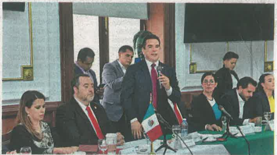
El dirigente nacional del Revolucionario Institucional reconoció que es necesario estar cohesionados como partido

Indicó que en la estrategia se definirá con claridad "lo que tenemos que hacer para ganar la confianza de los ciudadanos", además de que incluirá temas de debate e iniciativas que se impulsarían en el Congreso de la Ciudad de México. Detalló que todos quienes tienen un cargo de