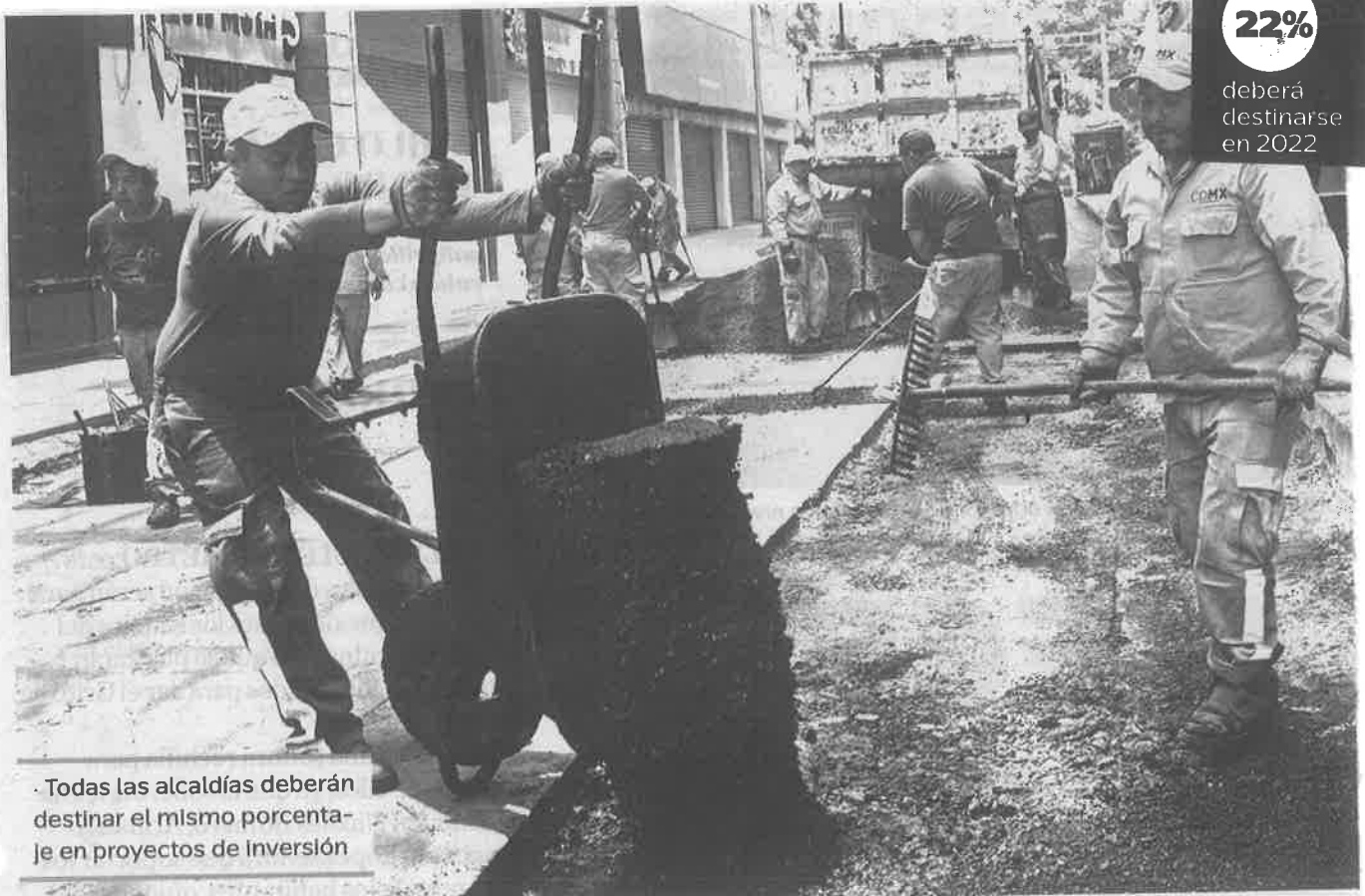
Todas las alcaldías deberán destinar el mismo porcentaje en proyectos de inversión