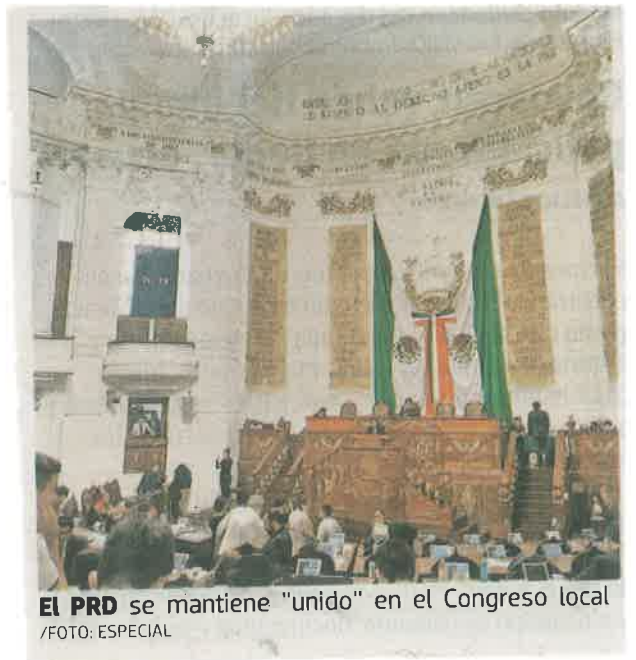
El PRD se mantiene "unido" en el Congreso local