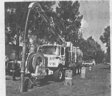
· Cuatro alcaldías cumplieron

En la Ciudad de México, de acuerdo con cifras de la Cuenta Pública, el gasto en obras públicas y proyectos productivos 2018, representó el 15 por ciento del presupuesto total ejercicio del sector público, con un total de inversión de 35 mil 875 millones de pesos, teniendo inclu-