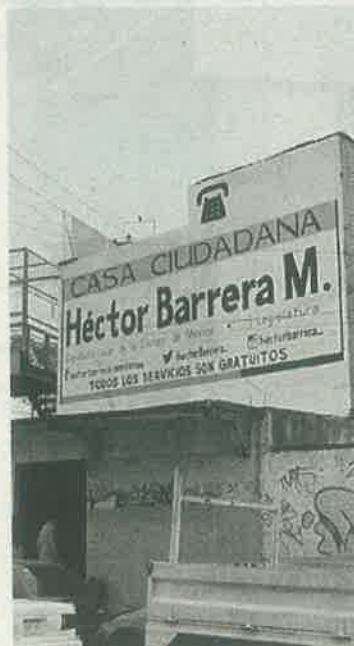
Hasta el módulo ciudadano del diputado Barrera fue robado

“Se debe reducir el tiempo de respuesta de los elementos policiacos. Jesús Orta Martínez, expuso en Comisiones del Congreso de la Ciudad de México, que con el arrendamiento de mil 885 nuevas patrullas, las autoridades capitalinas buscan duplicar la presencia de la policía en las calles de la CD-MX, así como disminuir el tiempo de respuesta de 50 a 15 minutos, pero no ha ocurrido”.