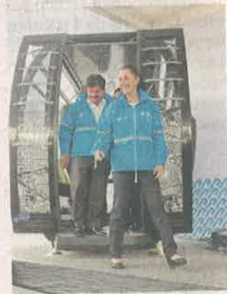
CSP probó una góndola.

Las autoridades capitalinas tienen previsto que la primera línea del sistema se termine de construir en menos de 500 días.