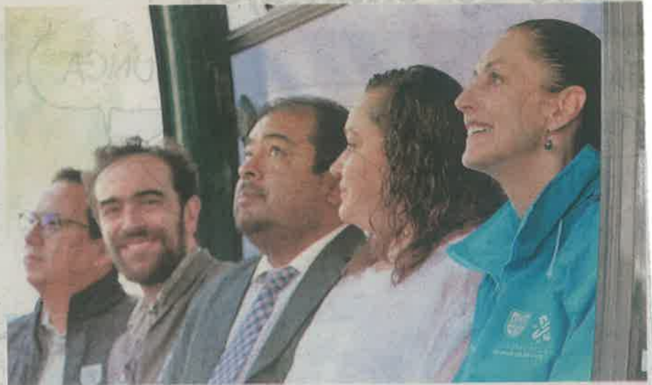
La jefa de gobierno, Claudia Sheinbaum, al iniciar obras del Cablebús Cuauhtepec-Indios Verdes

La obra inició en Avenida Ticomán 199, Colonia Santa Isabel Tola; esta línea contará con las estaciones: Indios Verdes, Ticomán, La Pastora, Campo de Madero, Cuauhtepec y Tlalpexco.