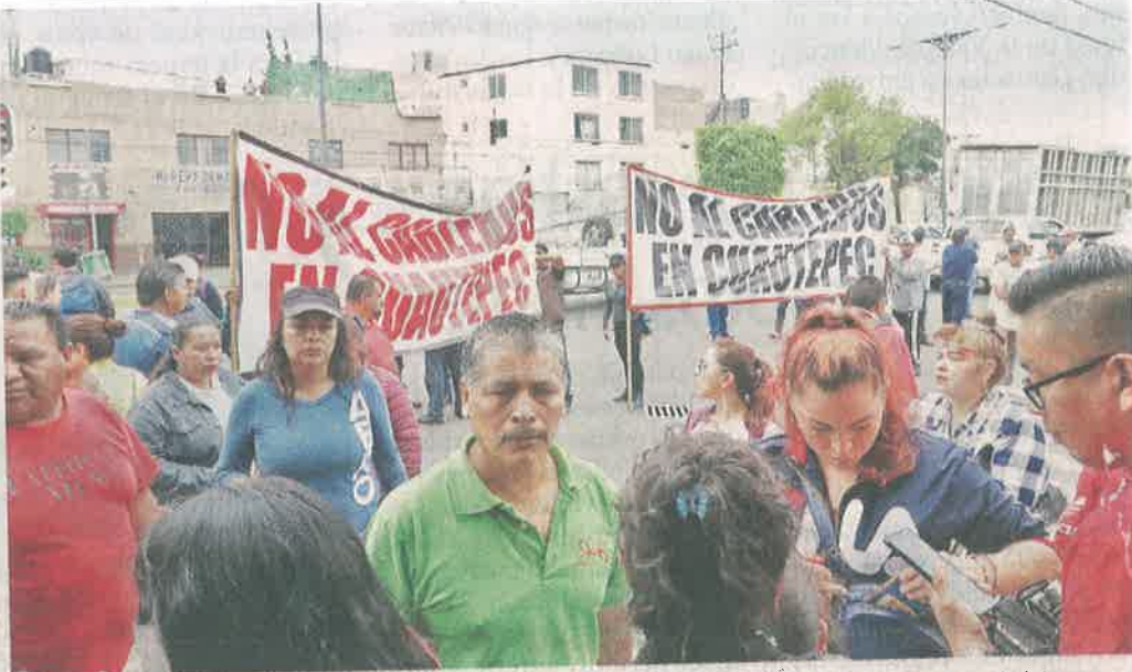
Propietarios de los terrenos en cuestión se manifestaron en el inicio de las obras del sistema.

tica con el dueño del predio para explicarles.