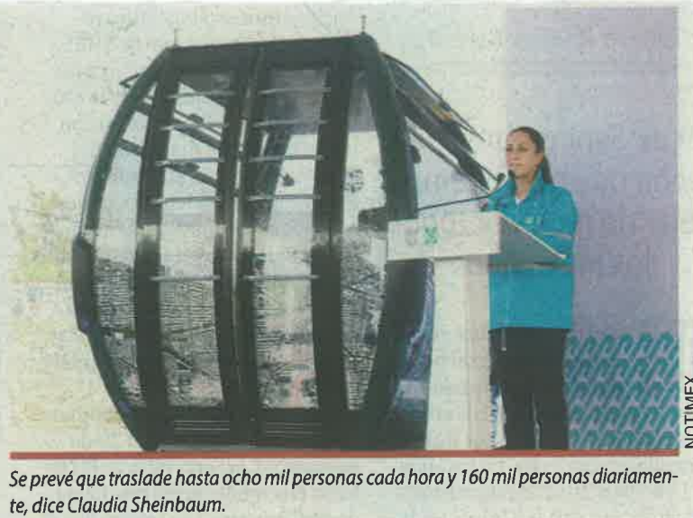
Se prevé que traslade hasta ocho mil personas cada hora y 160 mil personas diariamente, dice Claudia Sheinbaum.

“Hubo una modificación de una estación que iba a estar en el Instituto Politécnico Nacional y ahí los estudiantes no estuvieron de acuerdo, entonces se hizo la