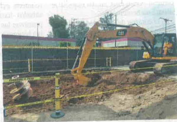
La terminal Indios Verdes quedará dentro de los talleres del Metro