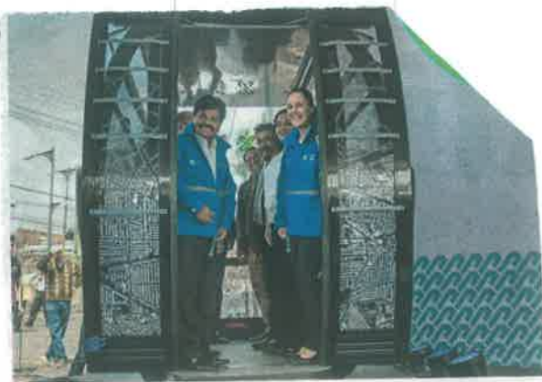
Sheinbaum destacó que es un proyecto que garantiza el derecho al transporte sustentable