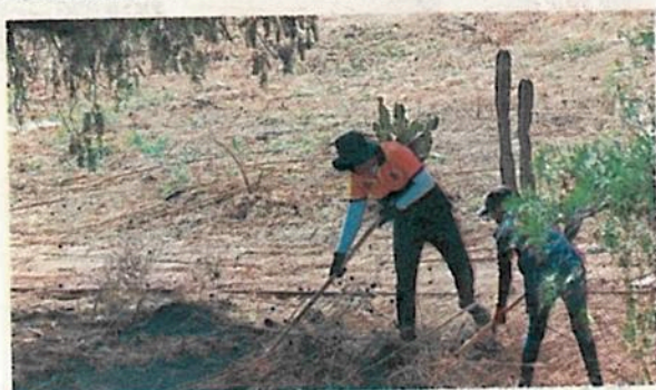
Exhortan a las 16 alcaldías a llevar a cabo un programa social

injustificados que carecen de especificaciones técnicas. Para solventar dicha problemática, "resulta de vital importancia generar condiciones que no sólo garanticen la supervivencia de estos espacios verdes, sino que aumenten en cantidad y, sobre todo, en calidad", sentenció la legisladora.