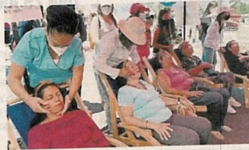
Las mamás pudieron disfrutar de mascarillas, masajes, yoga, entre otras actividades.

En su mensaje, dijo que las mujeres son las que han construido Iztapalapa, pues lo que hoy se tiene en las colonias, unidades habitacionales, barrios y pueblos originarios es producto del esfuerzo de las mamás. ●