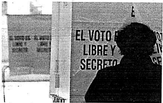
Acusan que peligró participación de vecinos

El concejal expuso que el alcalde da claras muestras de incapacidad para gobernar y de responder a intereses ajenos a los de la población