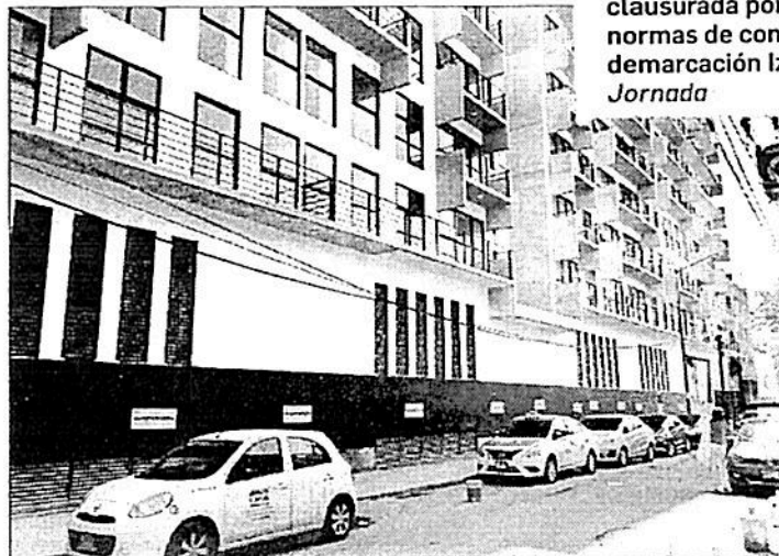
▲ Megadesarrollo inmobiliario clausurada por violar las normas de construcción en la demarcación Iztacalco.

En la colonia Reforma Iztacihuatl se clausuró de manera definitiva la obra de Playa Miramar número 386. Los desarrolladores intentaron mantener el proyecto, indicó Quintero, pero tras recurrir a diferentes instancias, no lo lograron porque pretendieron sustentarlo con un certificado de zonificación de la norma 26, que es para vivienda de interés social, y erigir 32 departamentos con otras características.