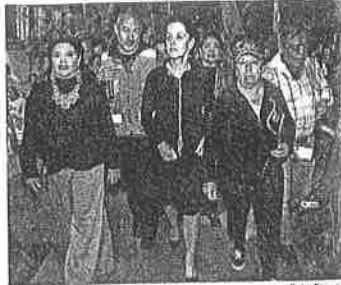
La jefa de Gobierno, Claudia Sheinbaum, recorrió el Sendero Seguro acompañada de la alcaldesa de Iztapalapa, Clara Brugada.