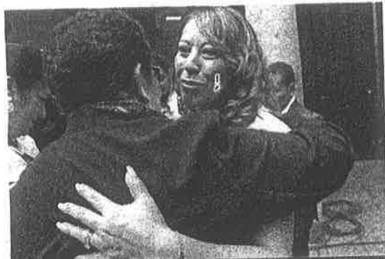
Ayer aceptó las disculpas de la procuradora Ernestina Godoy.