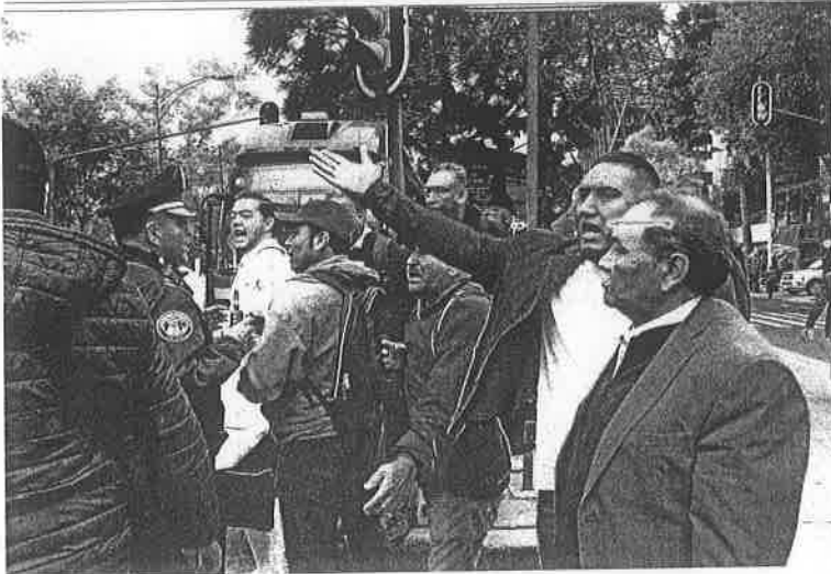
Usuarios del Metrobús mostraron su enojo porque perdieron su día de trabajo