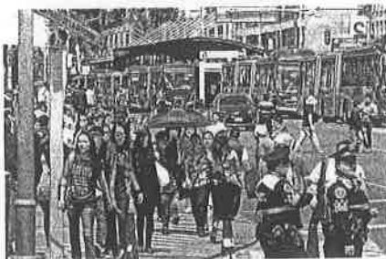
Al bloquear Reforma, la ciudad se partió en cuatro y no quedó más que caminar/ADRIÁN VÁZQUEZ

Los manifestantes se cuentan por cientos, pero los afectados son miles. Como Don Guillermo, que con bastón en mano, sorteó el bloqueo del paso del Metro-