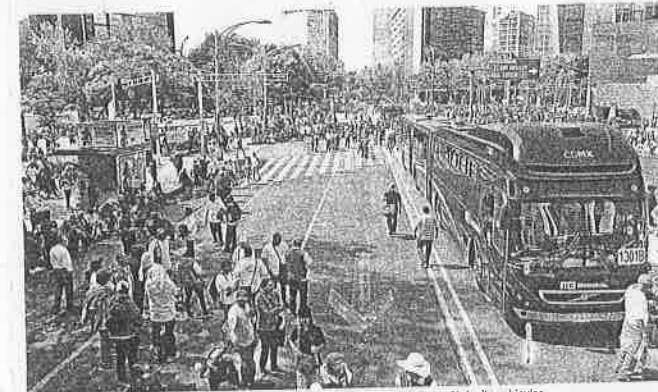
BLOQUEO. El cruce de Reforma e Insurgentes fue donde se afectó principalmente el tránsito vehicular.