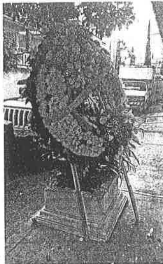
Coronas florales para muertos con mensajes intimidatorios aparecieron en dos puntos diferentes de la alcaldía Iztapalapa. Junto con textos que al final decían: "Feliz día de muertos".

Reflexión que en reiteradas ocasiones han visto ingresar al penal al subdirector de Seguridad de Centros Penitenciarios, Fallarill Cas-