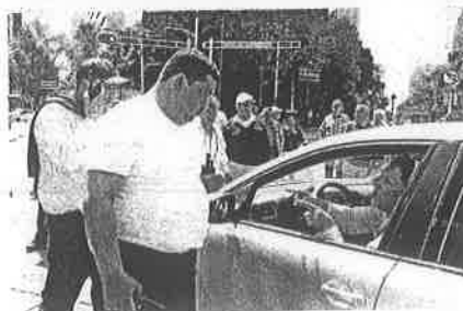
Automovilistas pasaron media hora sorteando sólo dos cuadras

bús o Mariel, quien padeció la marcha que hicieron el lunes los taxistas pues tuvo que caminar más de un kilómetro para llegar a su centro de trabajo, o Soledad, que se negó a viajar de Ecatepec hacia su centro de trabajo para no sufrir "un día más" en el tráfico.