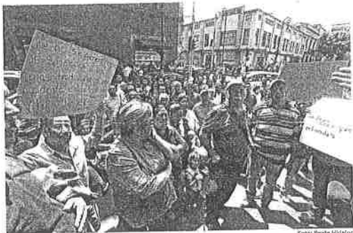
MANIFESTACIÓN. Durante la novena sesión ordinaria de la Comisión de Protección Civil y Gestión Integral de Riesgos del Congreso, integrantes de ferias protestaron afuera del Congreso.