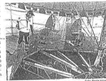
Este diario acompañó a funcionarios de Protección Civil que revisan ferias, pero carecen de un reglamento que los respalde