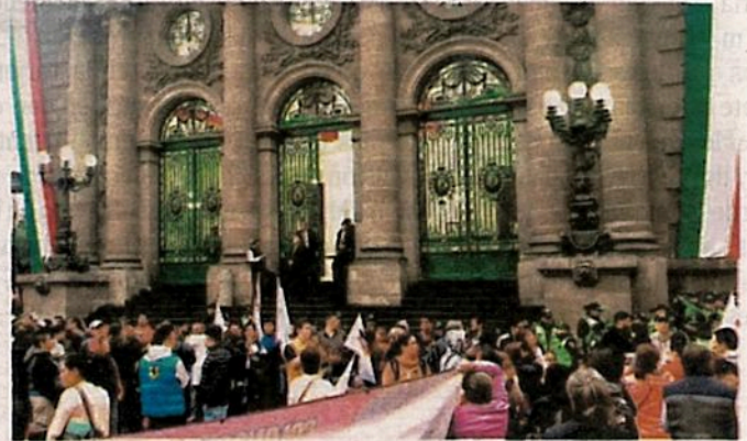
Cientos de comerciantes informales se manifestaron afuera del Congreso capitalino

"Ayer nos hicieron algunas observaciones el equipo de asesores del Grupo Parlamentario, y por eso decidimos no subirlo al