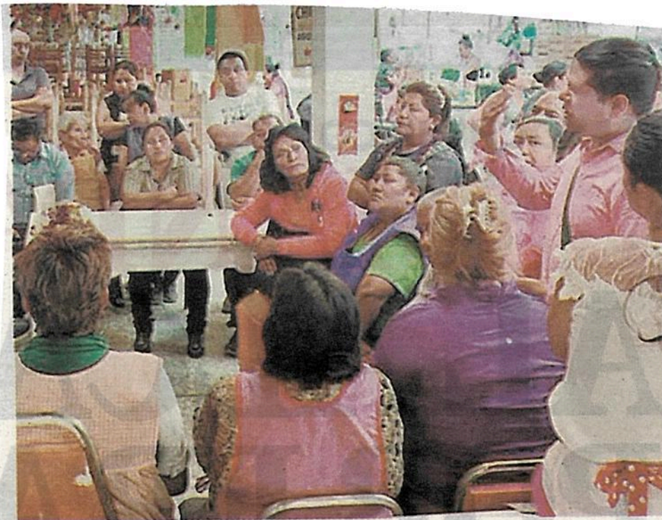
Los locatarios del Mercado 377, discuten las acciones a seguir

Aunque el exterior del mercado luce bien, por dentro hay muchos desperfectos