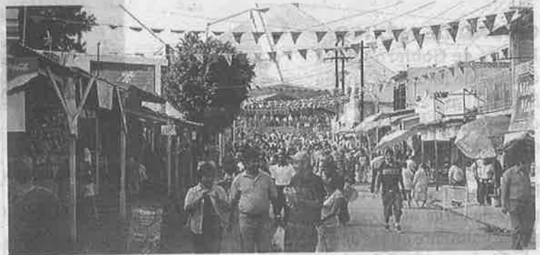
Comerciantes de deben entrar con su tajada