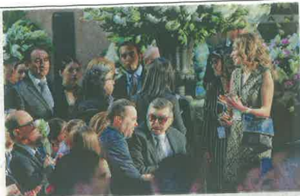
Jorge Ortiz de Pinedo llegó a acompañar a la familia del cantante, con quien hizo la película Gavilán o Paloma

Le siguió el actor Alex de la Madrid, visiblemente emocionado por la muerte de