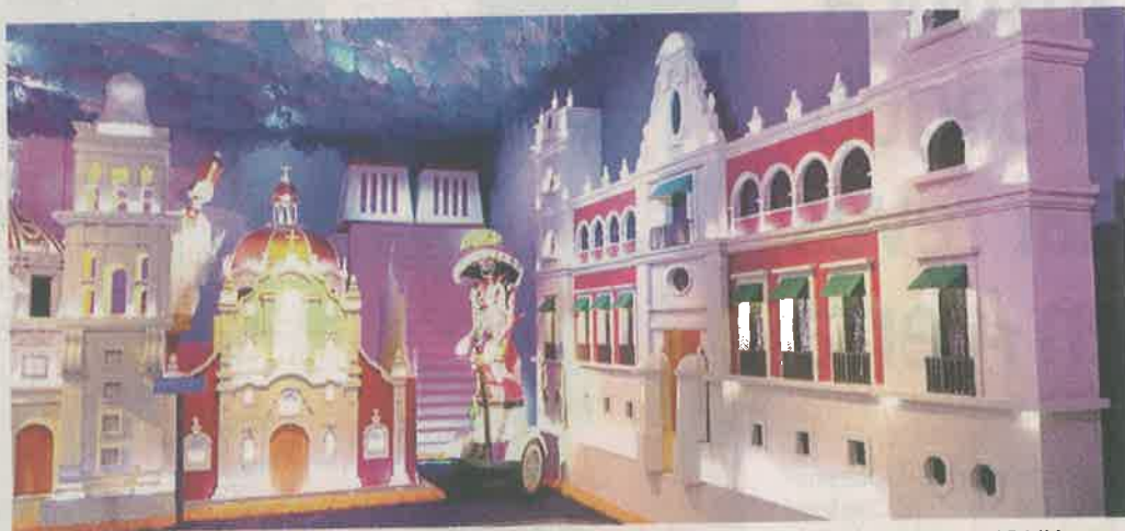
Algunos de los edificios icónicos también son aludidos en la ofrenda dedicada a la CDMX.

"Normalmente las ofrendas de Día de Muertos son a personas y en este caso es una ofrenda a la Ciudad de México, de cómo ha ido creciendo en el tiempo y sus grandes obras de ingeniería, así que la verdad es muy emotiva, muy bonita", co-