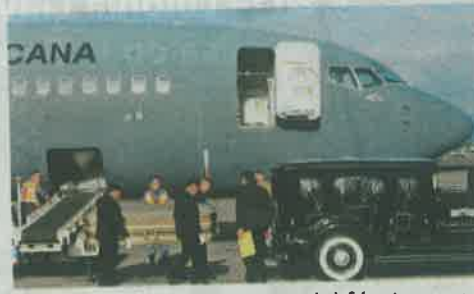
09:10 Las cenizas dentro del féretro son colocadas en la carroza fúnebre