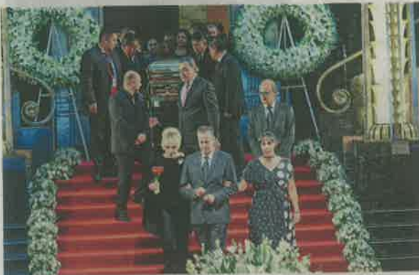
Al llegar el féretro al Palacio de Bellas Artes se escuchó la canción La nave del olvido

El intérprete de El triste recibió en la Ciudad de México un homenaje de más de siete horas entre cantos y vivas en su honor