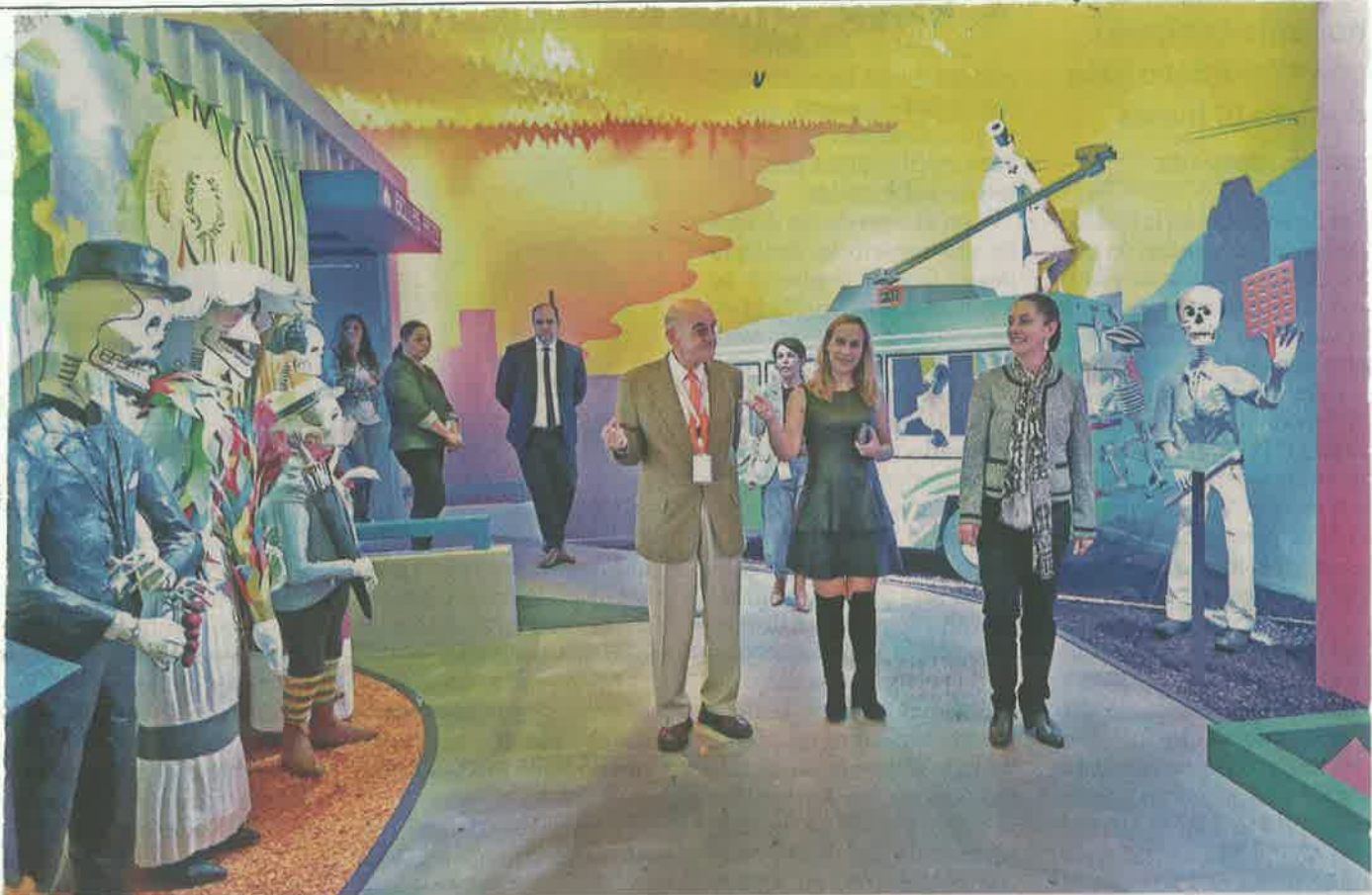
OBRAS. Infraestructura y sistemas de transporte de la Capital protagonizan la muestra en el Museo Dolores Olmedo.