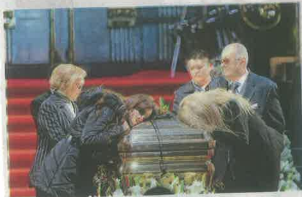
Lucía Méndez y Dulce se agacharon para susurrar palabras de cariño a su amigo