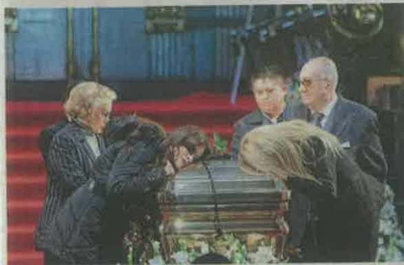
Lucía Méndez y Dulce se agacharon para susurrar palabras de cariño a su amigo