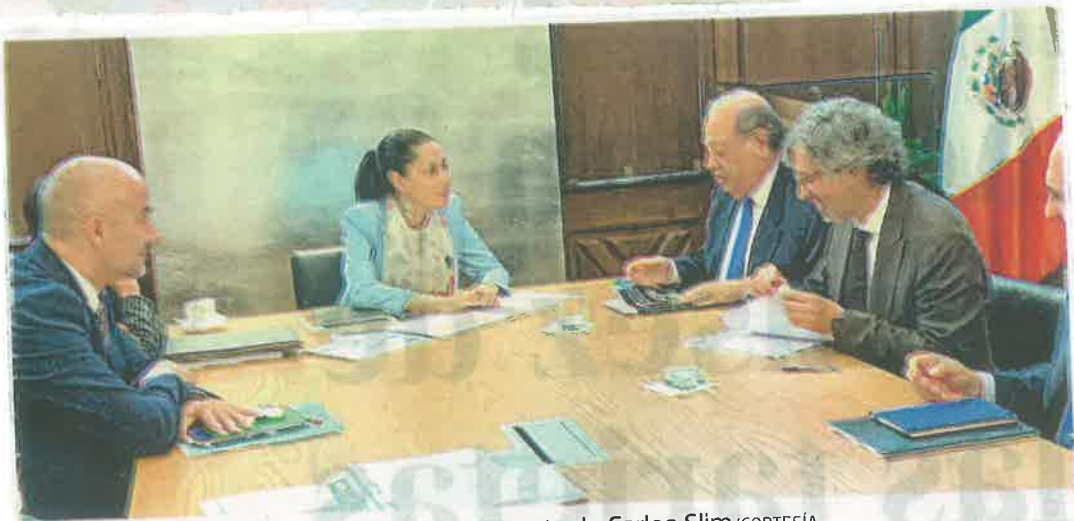
El gobierno de Sheinbaum evaluará la propuesta de Carlos Slim

"La inversión privada en la ciudad es muy importante, una parte fundamental es la inversión pública, otra es el propio financiamiento de la inversión pública que también se requiere", manifestó.