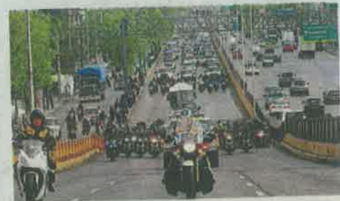
09:40 El cortejo partió escoltado rumbo al Palacio de Bellas Artes