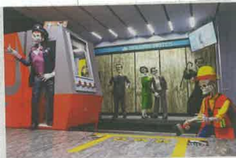
CULTURA. En el Museo Dolores Olmedo, en Xochimilco, la jefa de Gobierno visitó una ofrenda de muertos que homenajea la arquitectura de la ciudad.