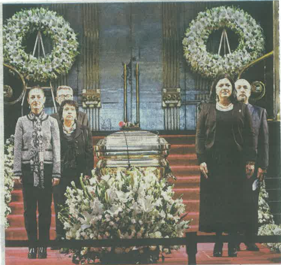
● La jefa de gobierno, Claudia Sheinbaum y la secretaria de Cultura, Alejandra Frausto