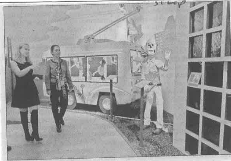
◀ La jefa de Gobierno, Claudia Sheinbaum, visitó la ofrenda dedicada a la infraestructura de la Ciudad de México en el Museo Dolores Olmedo.