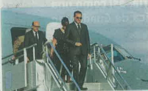
09:00 El avión de la Fuerza Área aterrizó procedente de Miami