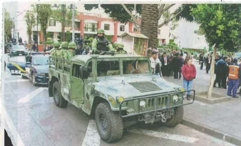
SOLDADOS. Los elementos llegaron en patrullas blancas de la Guardia Nacional, pero también en vehículos con camuflaje militar.