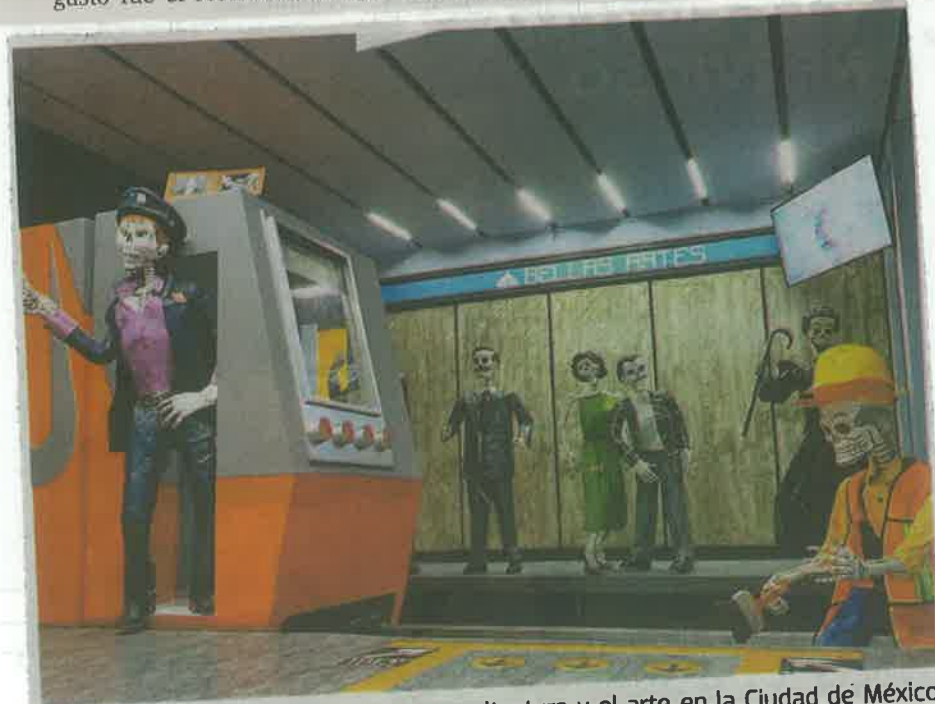
La ofrenda relata la relación de la arquitectura y el arte en la Ciudad de México

"Vengan a visitarla, aquí el Museo Dolores Olmedo se caracteriza por las ofrendas del Día de Muertos que siempre son muy bellas, ellos también tiene el Museo de Frida Kahlo y el de Anahuacalli donde también se hacen ofrendas, es también un homenaje a los arquitectos que hicieron cada una de las obras simbólicas de la Ciudad".