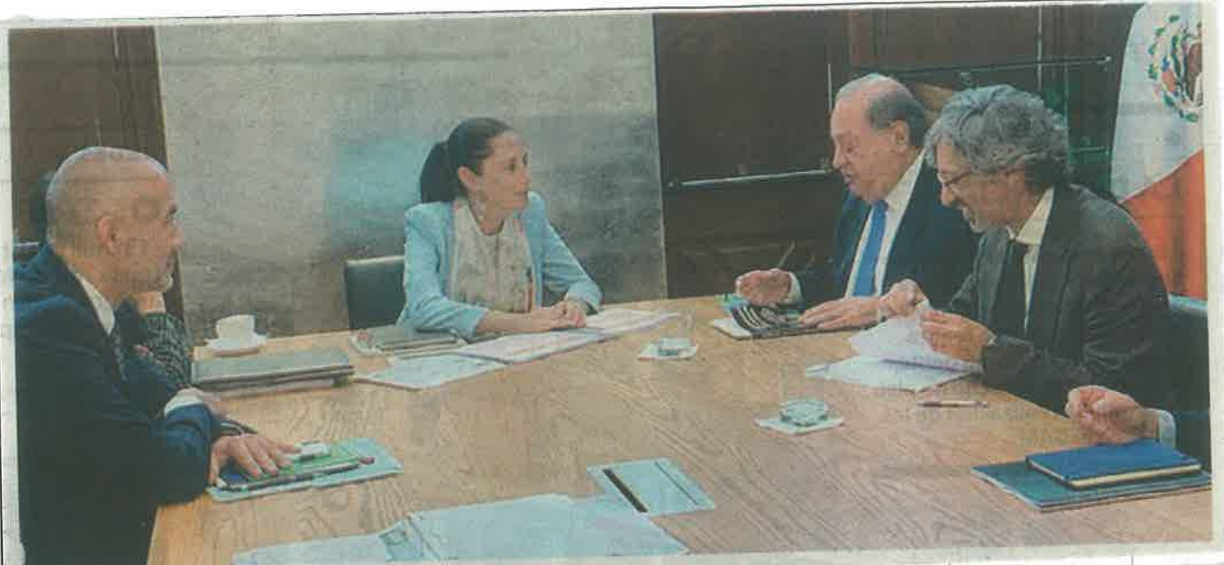
La Constitución, dijo Sheinbaum, es muy clara en que no se debe privatizar el agua