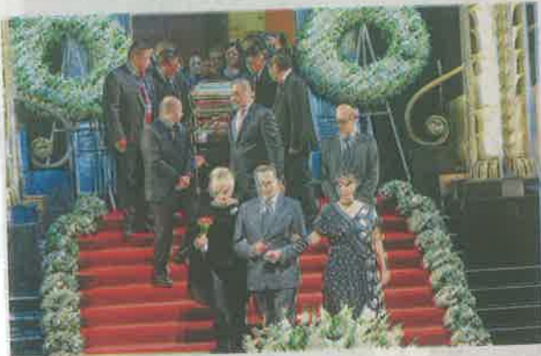
Al llegar el féretro al Palacio de Bellas Artes se escuchó la canción La nave del olvido

El intérprete de El triste recibió en la Ciudad de México un homenaje de más de siete horas entre cantos y vivas en su honor