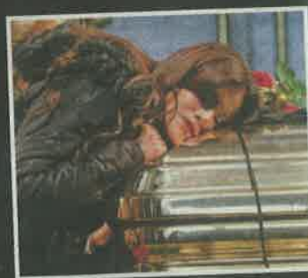
Lucía Méndez se acercó a la urna del cantante para despedirse.

y "He renunciado a ti" fueron interpretados por sus fans que, sin conocerse entre ellos, se unieron para decirle adiós al cantante.