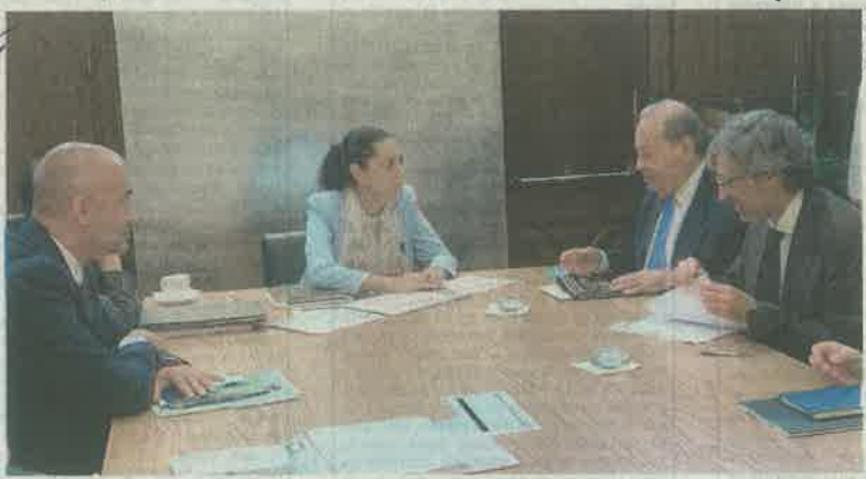
Carlos Slim Helú presentó a la mandataria algunos de los proyectos que un grupo de empresarios expusieron a AMLO, planeados para la capital.

“El desde hace muchísimos años está interesado en el tema del agua en la Ciudad, más que como una inversión privada a él le interesa una inversión de ellos. Le [preocupa] de manera muy importante disminuir la sobreexplotación del acuífero, él