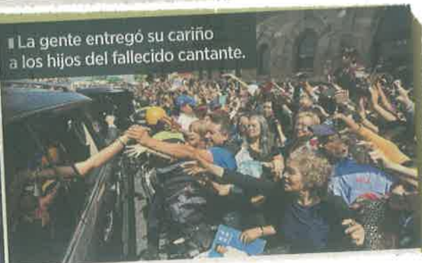
■ La gente entregó su cariño a los hijos del fallecido cantante.