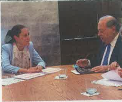
CLAUDIA Sheinbaum con el empresario, el martes.