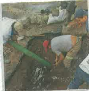
7 Busca Slim invertir en sistema hidráulico