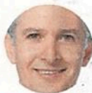
Alfredo Del Mazo