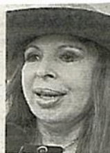
La alcaldesa morenista desconoce a los vecinos

7) Promover la creación de empleos mediante los convenios ante empresarios o programas de autoempleo.