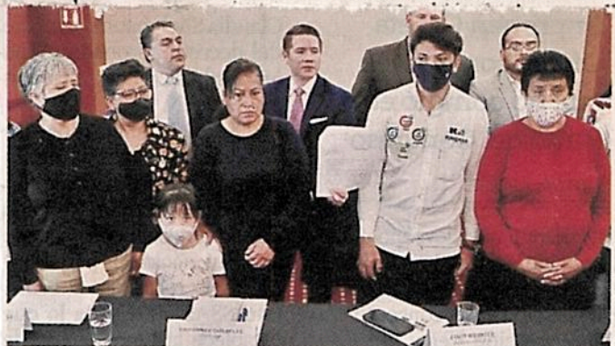
En la conferencia de prensa, se hizo un llamado a deudos y heridos para que se sumen al proceso.

Sin embargo, se dejó el tema del lado desde hace más de una semana, cuando se recordó que los dictámenes de los tramos elevados, a excepción de Línea 12, es-