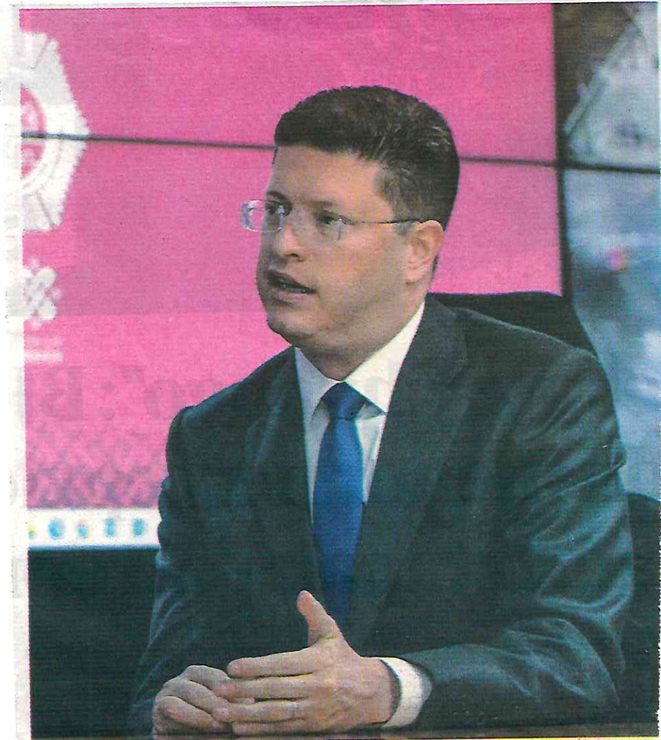
El jefe de la Policía capitalina