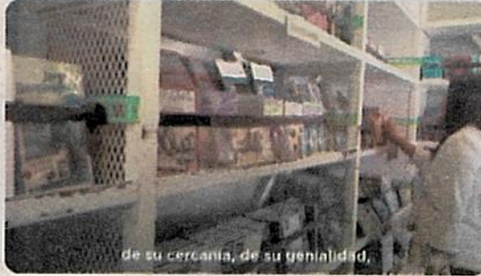
de su cercanía, de su genialidad,