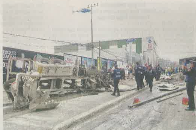
Al parecer la revolovedora se quedó sin frenos.

La Secretaría de Gestión Integral de Riesgos y Protección Civil informó que hubo más lesionados con heridas leves atendidos en el lugar.