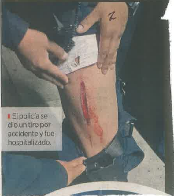
El policía se dio un tiro por accidente y fue hospitalizado.

El oficial fue llevado por el ERUM a un hospital.