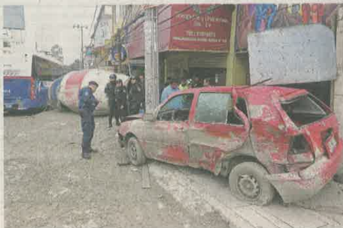
El vehículo arrasó con 11 autos y los llenó de cemento.

personas lesionadas es el saldo preliminar.