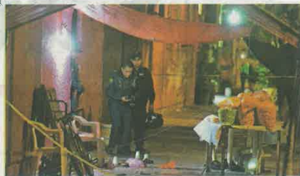
En esta vecindad tuvo lugar la sangrienta balacera