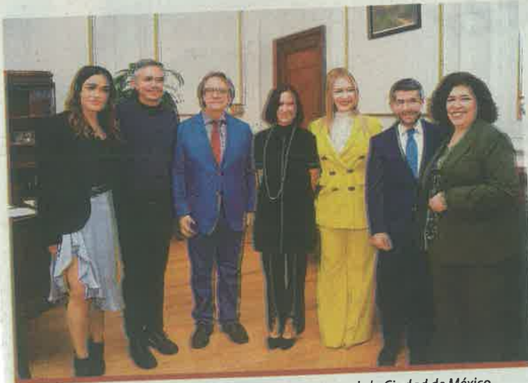
La funcionaria fue bien recibida en su visita al Congreso de la Ciudad de México.

Por último pidió a nombre de los diputados informar sobre los recursos destinados para el desabasto de agua, a los residuos sólidos y para los habitantes de la alcaldía de Tláhuac.