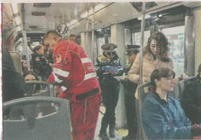
En total 13 usuarios del Metrobús recibieron atención médica.