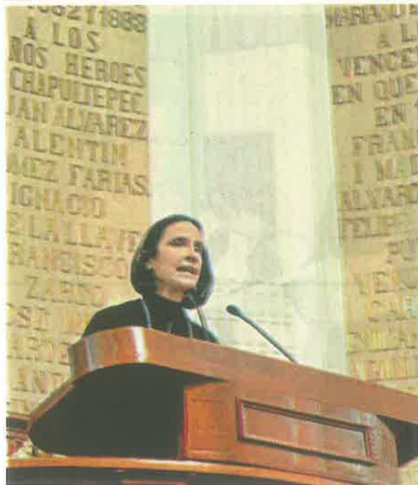
Es la segunda funcionaria en subir al pleno, el jueves toca a la procuradora Ernestina Godoy

González dio a conocer que se aplicó un programa para que los deudores se pusieran al corriente en el pago de sus gravámenes, lo cual ha dado como resultado que 769 mil 754 cuentas estén al corriente.