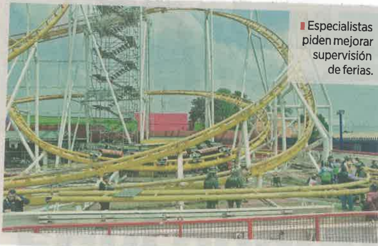
■ Especialistas piden mejorar supervisión de ferias.

La instalación de juegos mecánicos está regulada a través del Reglamento de Construcciones de la Ciudad de México, donde se esta-