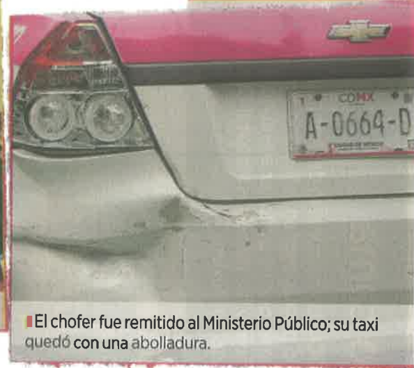
El chofer fue remitido al Ministerio Público; su taxi quedó con una abolladura.