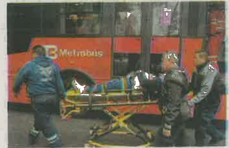
Una mujer que viajaba en el Metrobús es llevada al hospital por los golpes que recibió

Al externar "intensos dolores" dos mujeres fueron llevadas a hospitales cercanos para que médicos especialistas les realizaran diagnósticos y exámenes a profundidad para