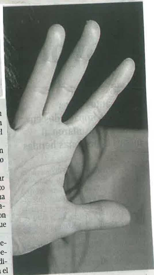
Las mujeres víctimas de violencia familiar que solicitaron el derecho a medidas de protección, aún con éstas viven con miedo y se sienten vulnerables

Lee la historia completa en www.la-prensa.com.mx