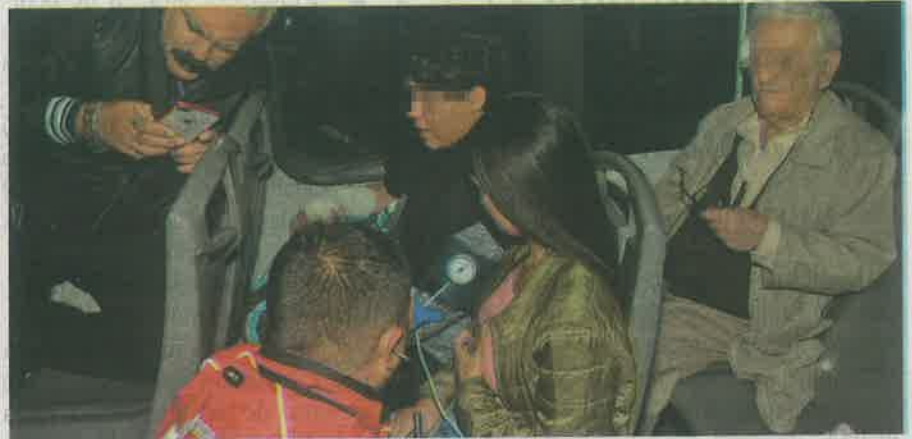
Algunos de los pasajeros fueron atendidos en el interior del vehículo

Más tarde, paramédicos de instituciones particulares, de la Cruz Roja Mexicana y del Centro Regulador de Urgencias Médicas