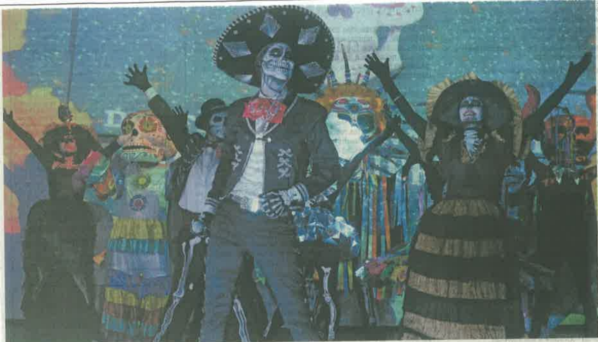
Durante la presentación oficial del Desfile Internacional de Día de Muertos, el cual se realiza por cuarto año consecutivo, algunos de los personajes que participarán en este magno evento ballaron a ritmo de cumbia.