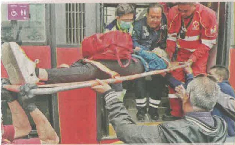
Los pasajeros resultaron policontundidos, informó Protección Civil.

En tanto, paramédicos de varias instituciones se presentaron para atender a los usuarios, quienes sólo sufrieron golpes.