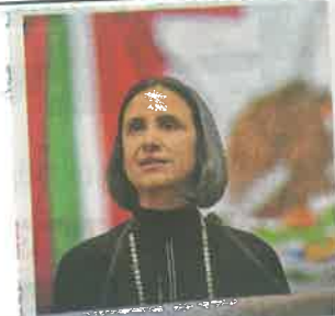
8 2 Rinde cuentas en el Senado secretaria de Finanzas