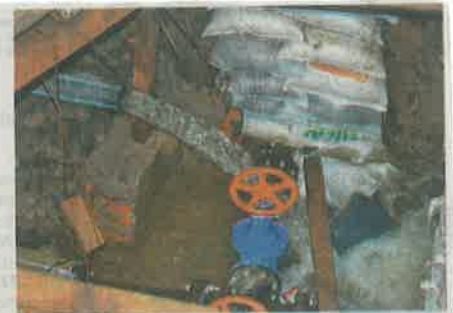
Se registra fuerte fuga de agua en obras mal realizadas en la Alcaldía Tláhuac

lluvias durante el año y que ello nos ayudara a tener una aportación extraordinaria hacia las presas", determinó Carmona Paredes.