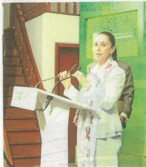
Insistió en que a los taxistas les molestó el combate a la corrupción

“Tengo la información de que una buena parte de estos grupos, se beneficiaban de la corrupción que había en la Secretaría de Movilidad y hoy están muy molestos porque ese adicional que estaban recibiendo pues ya no lo tienen y por eso lo que mencionó es que no va a haber marcha atrás en el combate a la corrupción”.