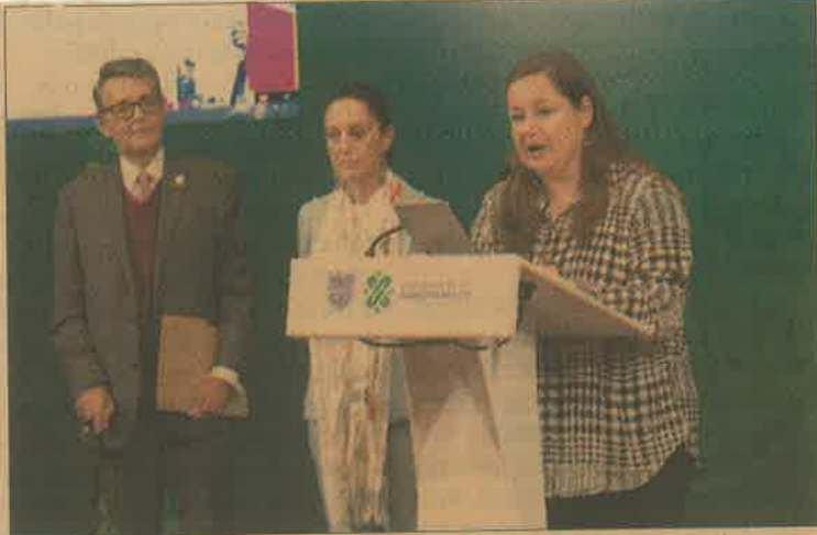
La Brigada para Leer en Libertad regalará 10,000 libros.