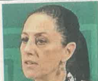
Claudia Sheinbaum, Jefa de Gobierno

Creemos que la Constitución de la Ciudad de México le da al Congreso de la Ciudad toda esta atribución, de hecho existía una Ley de Cultura Cívica en la Ciudad. No es nuevo".