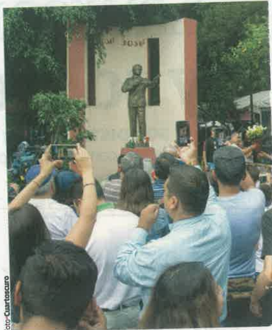
FANS del astro, el pasado 28 de septiembre, en el Parque de la China.

volará a Miami para trasladar los restos del cantante.