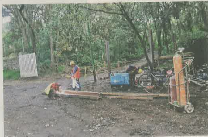
En el parque se tiene contemplada la instalación de luminarias a base de celdas solares en senderos abiertos.

Después de caminar con vecinos del pueblo de San Andrés Totoltepec por caminos del parque, la Mandataria explicó que ante las invasiones se estaban extendiendo, la superficie de 700 hectáreas, equivalentes al Bosque de Chapultepec, fue expropiada para pre-