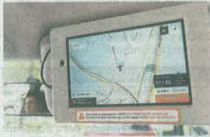
La aplicación L1BRE no funcionó en los taxis en la pasada administración.

"Tengo información de que una buena parte de estos grupos se beneficiaba de la corrupción que había en la Secretaría de Movilidad. Hoy están