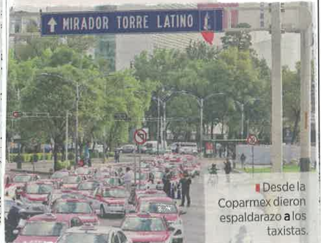
Desde la Coparmex dieron espaldarazo a los taxistas.