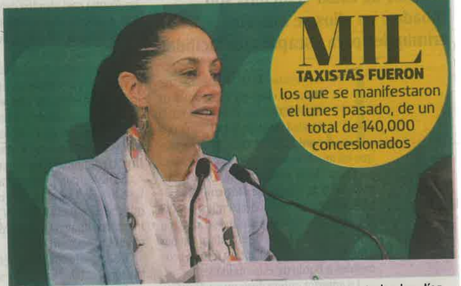
Claudia Sheinbaum reconoció que en la Ciudad hay taxistas que todos los días desarrollan un trabajo honesto

"No se trata aquí de señalamientos específicos, pero sí de que se tocaron muchos in-