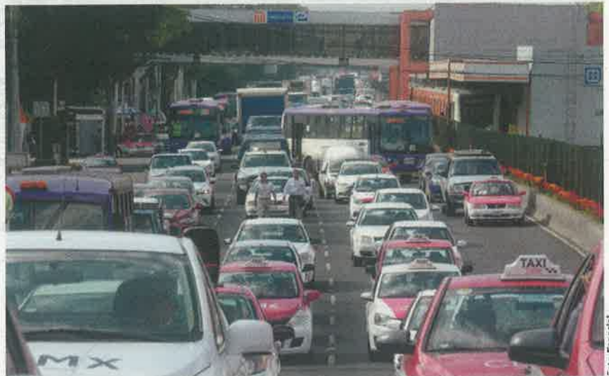
RULETEROS bloquean Calzada de Tlalpan, en protesta por las apps, el lunes pasado.

LA JEFA de Gobierno afirma que los inconformes cobraban 50% sobre el costo de trámites en los centros de La Virgen y El Coyoil; PGJ indaga a funcionarios de la administración pasada