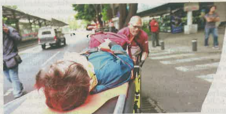
VÍCTIMA. Una de las personas lesionadas, un usuario del Metrobús, tuvo que ser trasladada a un hospital cercano para su atención.

Sheinbaum Pardo recordó que con la digitalización de trámites de concesionarios de taxis para operar fueron cerrados los centros de La Virgen y el Coyol y ahora éstos se hacen por Internet. /NOTIMEX