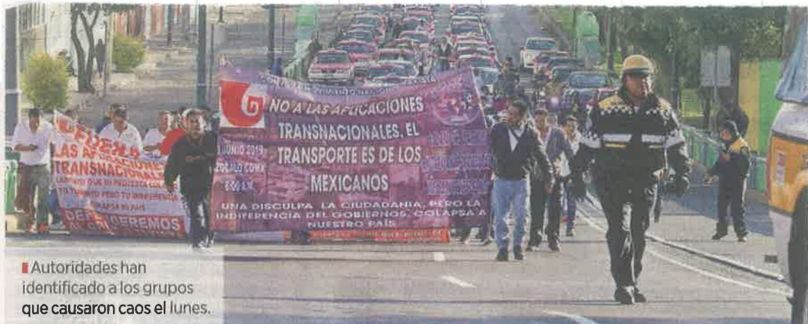
Autoridades han identificado a los grupos que causaron caos el lunes.