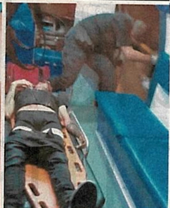
Usuarios de redes sociales compartieron los momentos de terror que vivieron durante el desarrollo de la fiesta privada; algunos publicaron que las salidas de emergencia fueron bloqueadas

KEVIN RUIZ 22-2019 —metropoli@eluniversal.com.mx