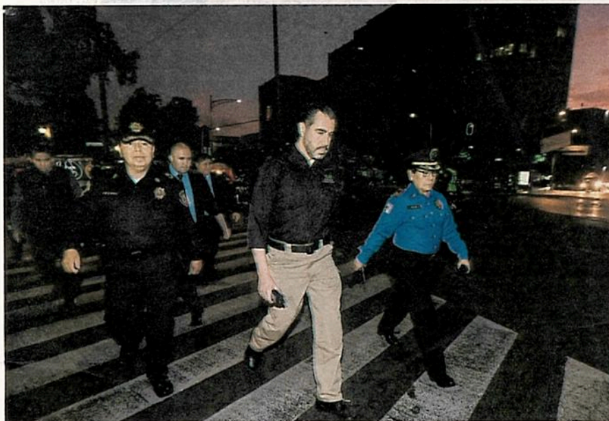
Las autoridades han avanzado en la detección de las narcotienditas/ROBERTO

"Esto independientemente de la agenda de seguridad que tenemos en cada uno de los 847 cuadrantes, de manera que la semana se le dio prioridad a ese tipo de actividad conjuntamente con la Policía de Investigación y atacamos más de 25 puntos en todos los casos con gente detenida...", afirmó Orta Martínez.