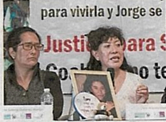
PRESENTES. En una conferencia, familiares pidieron justicia.