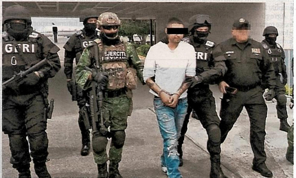
BAJO CUSTODIA. El Mawicho fue detenido el viernes en Zapopan, Jalisco, por elementos de la Procuraduría capitalina y del Ejército mexicano.

De acuerdo con las autoridades, el Mawicho forma parte del Cartel Jalisco Nueva Generación y cuatro días antes del crimen viajó de Jalisco a la capital del país para cometer la