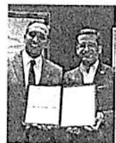
El Consejero y el Secretario de la Contraloría acordaron la defensoría.