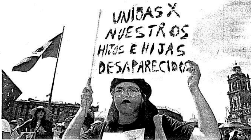
Saldrán a las calles en noviembre para seguir la lucha

El criterio de que toda muerte violenta de mujeres sea investigado como feminicidio, en la realidad no es un criterio cumplido"