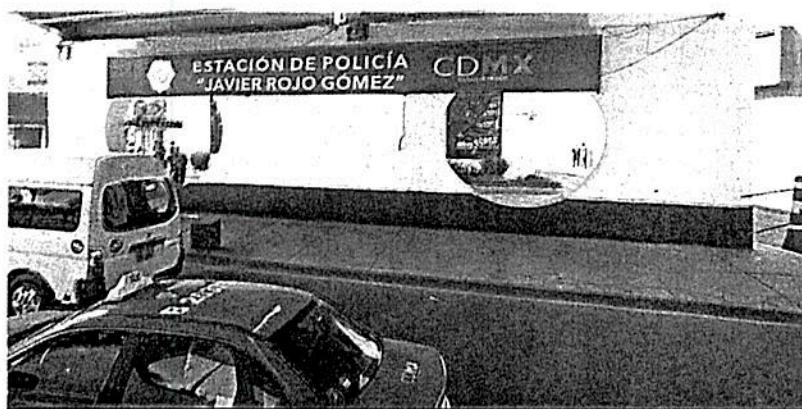
Durante la administración de Miguel Ángel Mancera estos módulos eran centros de aproximación y denuncia ciudadana de la policía.