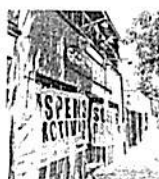
El operativo dio respuesta a las quejas ante la Alcaldía.

El Invea también repuso sellos en Casa Vau, en Felipe Carrillo Puerto 9, así como en Calco 6, Cocina Mexicana, donde estos también fueron arrancados.