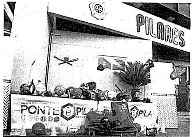
Claudia Sheinbaum inauguró uno de estos módulos convertidos en Pilares, el ubicado en la Avenida Javier Rojo Gómez, en la alcaldía de Iztacalco.

Con la apertura del Pilares Rojo Gómez suman 58 los Puntos de Innovación, Libertad, Artes, Educación y Saberes en la Ciudad de México, que actualmente atienden a 240 mil personas de todas las edades, en los que se garantiza el derecho de acceso a la educación, la cultura y el deporte; además se ofrecen talleres para la autonomía económica y capacitación para el empleo.