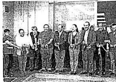
En la alcaldía Iztacalco inauguraron ayer el Pílar 58; las autoridades informaron que este año abrirán 150 en total y 150 más en 2020.

gran desorganización, "por lo que desde que llegamos [al gobierno] regresamos a los policíacos a las unidades territoriales donde estuvieron originalmente y que constituyó Andrés Manuel López Obrador, cuando fue jefe de Gobierno". Por ello, 300 policíacos que estaban