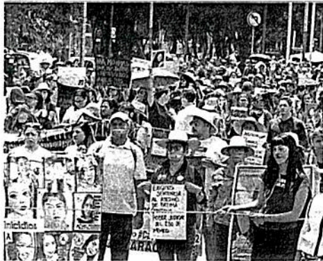
Madres unieron su dolor para seguir en la búsqueda de sus hijas