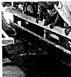
La muerte del joven poblano

CIUDAD DE MÉXICO.— Tras la muerte de un joven ahogado en el canal de Xochimilco, se evidenció la venta desmedida de alcohol y droga en el área de trajineras y otros espacios. En julio