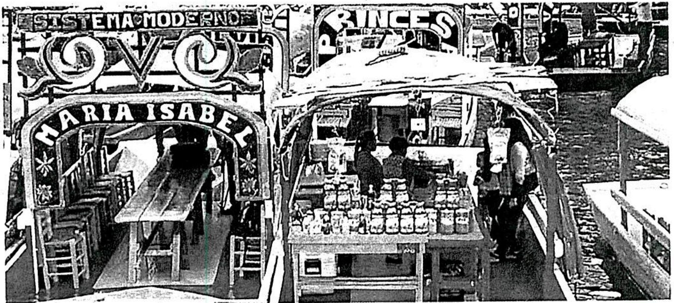
Exigen un mayor control entre autoridades y prestadores de servicios en la zona de las trajineras

● Tras la muerte de un joven ahogado, se evidenció la comercialización de bebidas alcohólicas y enervantes en el área de trajineras, sin que el alcalde haga algo 2