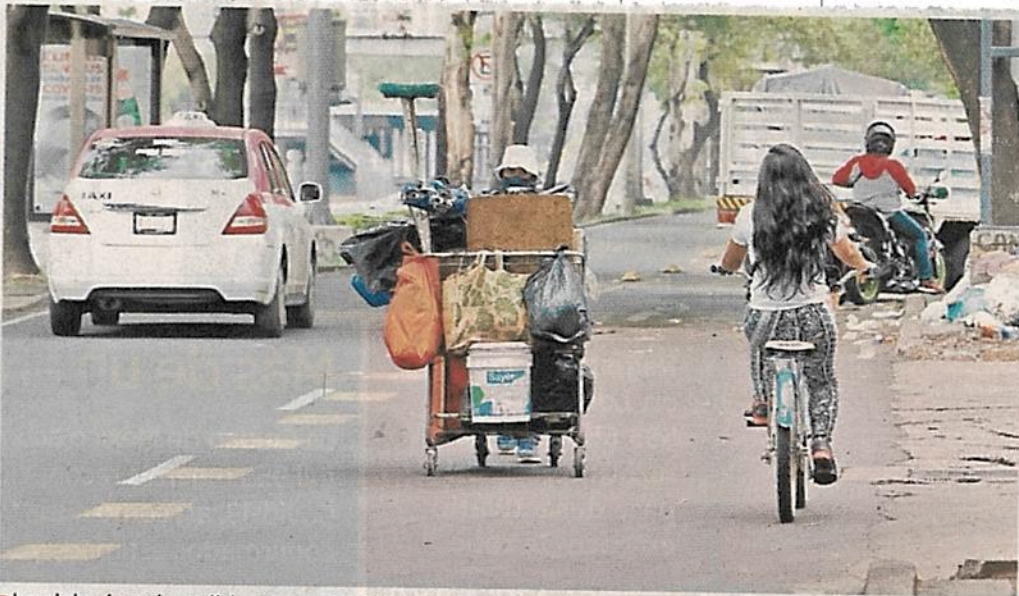
■ La ciclovía es invadida por motociclistas que la transitan y automóviles que se estacionan.