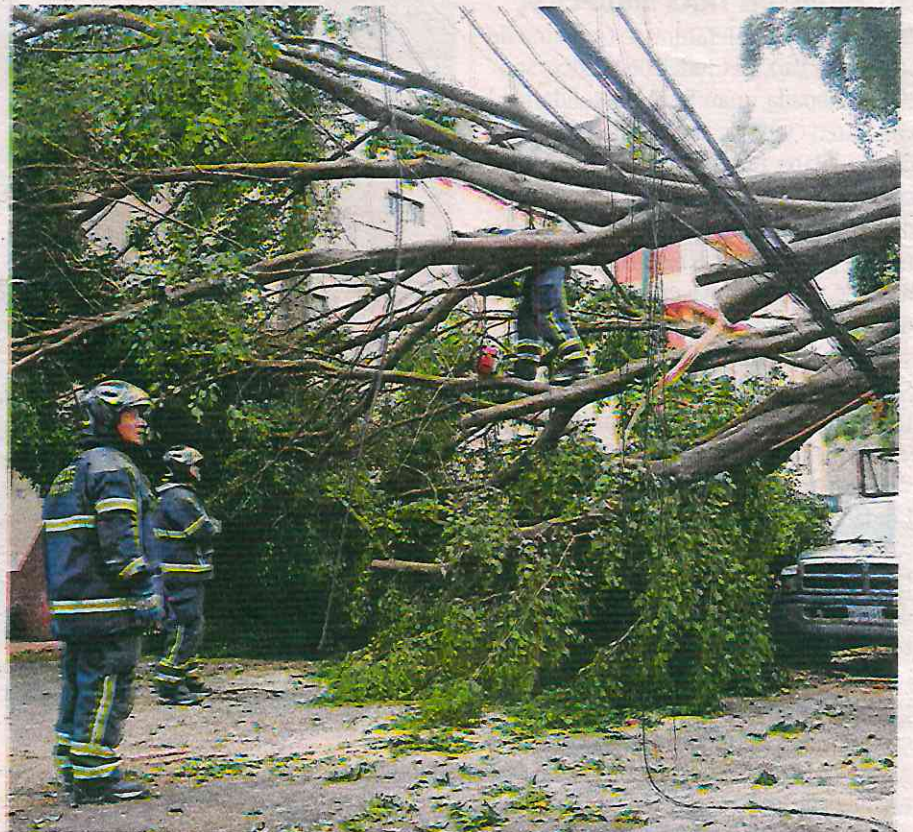
La caída de árboles provocó afectaciones en varias vialidades en diferentes colonias