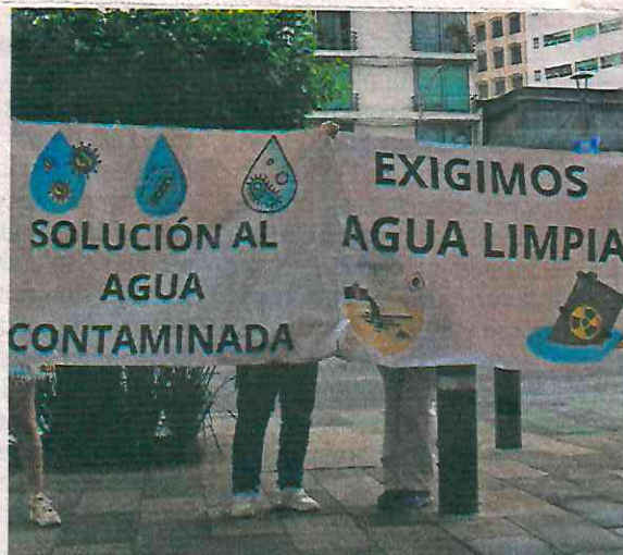
Vecinos de la Benito Juárez se manifestaron al conocer que la información del agua está reservada.

El Gobierno de la Ciudad de México ha señalado que en este momento el agua está dentro de los parámetros normales y siguen las investigaciones para saber la causa por la que se contaminó el pozo. ●