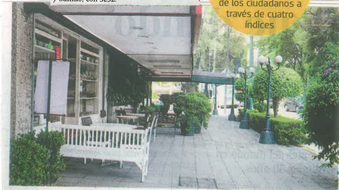
Benito Juárez es una de las mejor calificadas, aunque después del top 20

76 LOCALIDADES se evalúan con la opinión de los ciudadanos a través de cuatro índices