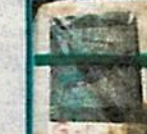
✓ 40 paquetes de 1kg de clorhidrato de cocaína marcados con sellos de "COLIBRI".