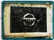
✓ 80 paquetes de 1kg de clorhidrato de cocaína marcados con sellos de "NISSAN"