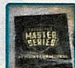
✓ 58 paquetes de 1kg de clorhidrato de cocaína marcados con sellos de "FREESTYLE MASTER SERIES".