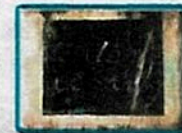
✓ 36 paquetes de 1kg de clorhidrato de cocaína marcados con sellos de "LEXUS".