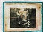
✓ 171 paquetes de 1kg de clorhidrato de cocaína marcados con sellos de "LDA" Deportivo Alajuelense