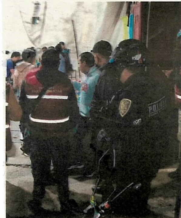
Policías atienden a la población