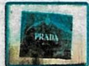
✓ 184 paquetes de 1kg de clorhidrato de cocaína marcados con sellos de "PRADA".