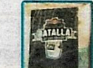
✓ 68 paquetes de 1kg de clorhidrato de cocaína marcados con sellos de "BATALLA".