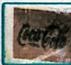
✓ 32 paquetes de 1kg de clorhidrato de cocaína marcados con sellos de "COCA COLA".