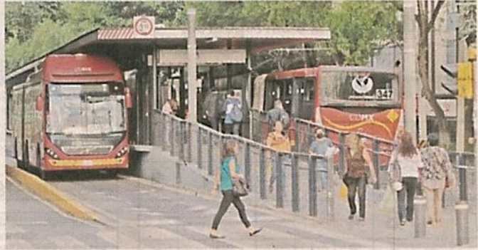
■ En la estación Etiopía, la afluencia bajó considerablemente.

“Y aquí no es como en el Metro, que no se puede hacer, por lo menos antes de abor-