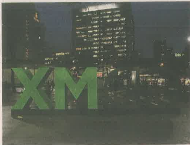
■ Pese a la rehabilitación de hace dos años, la glorieta no cuenta con luz y sufre deterioro.

Instalaciones eléctricas dañadas, pisos manchados, conexiones descompuestas y la acumulación de basura alrededor de los accesos a la