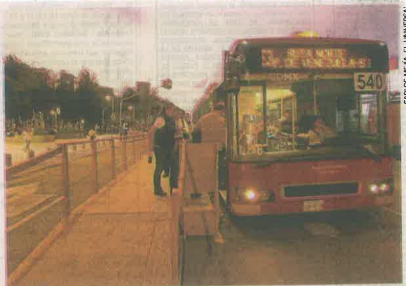
En Bellas Artes, rumbo a San Lázaro, se construyó una estación provisional de la Línea 4 del Metrobús, hecha de madera.