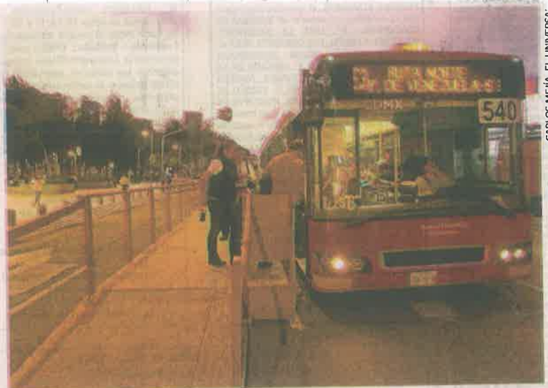
En Bellas Artes, rumbo a San Lázaro, se construyó una estación provisional de la Línea 4 del Metrobús, hecha de madera.