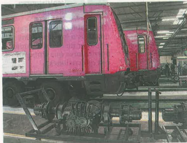
El desgaste de piezas es mayor que en otras líneas

El Sistema de Transporte Colectivo contrató a la empresa francesa Systra para que realizara un diagnóstico de la Línea 12. El resultado fue que esta ruta "estaba en-