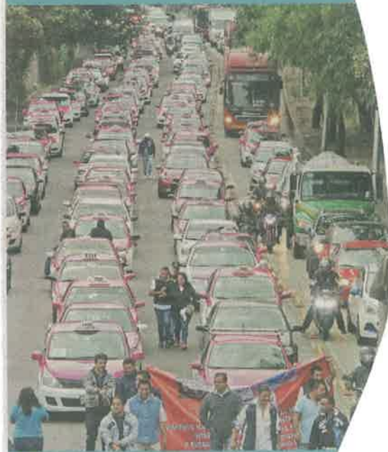
Los taxistas planean repetir hoy la dosis de caos que generaron el 3 de julio pasado.

Los ruleteros afirman que no se han cumplido los acuerdos a los que llegaron en el diálogo con la Secretaría de Movilidad.