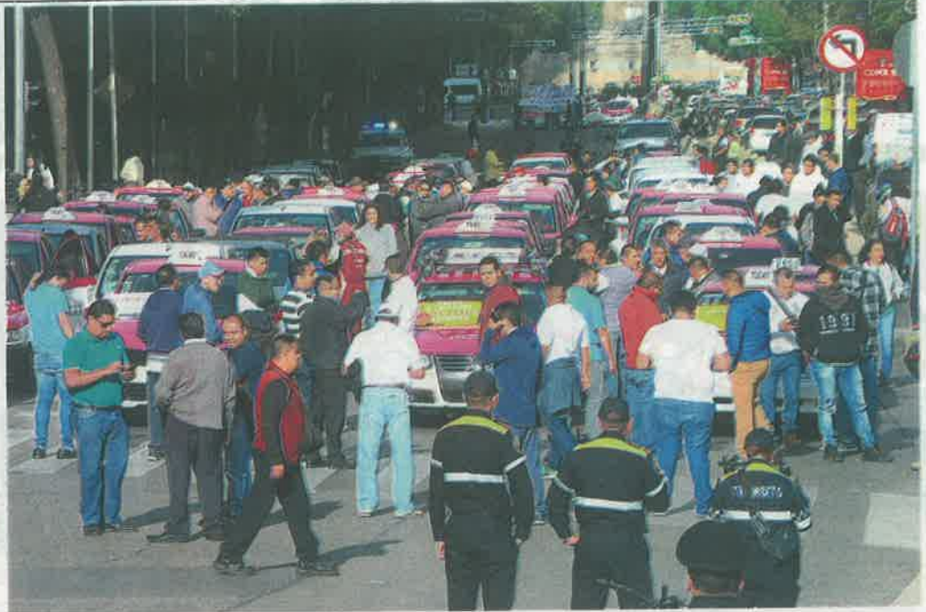
El 3 de junio pasado miles de personas tuvieron que caminar ante la protesta de los ruleteros

HORAS SE espera dure la protesta en la Ciudad de México