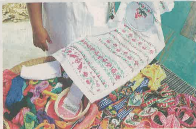
La pedagoga comparte con las tejedoras diversas técnicas.

"Es en Milpa Alta donde estaban la mayoría de tejedoras y, aunque varias veces fuimos a buscarlas para comprar sus prendas o pedirles que nos enseñaran, se