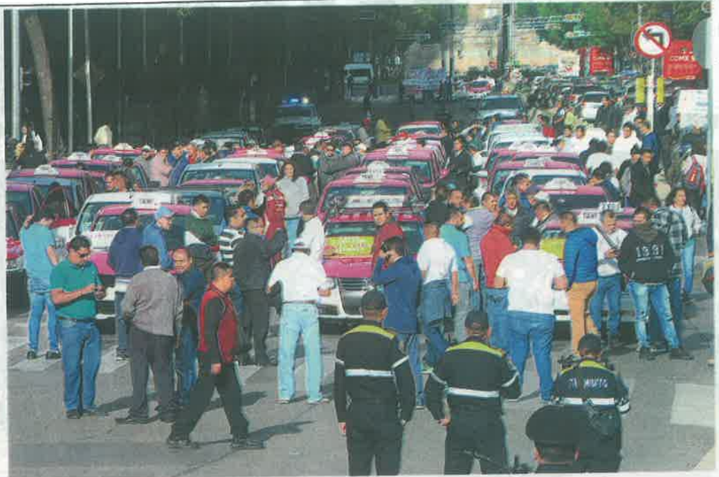
El 3 de junio pasado miles de personas tuvieron que caminar ante la protesta de los ruleteros/LAURA LOVERA

HORAS SE espera dure la protesta en la Ciudad de México