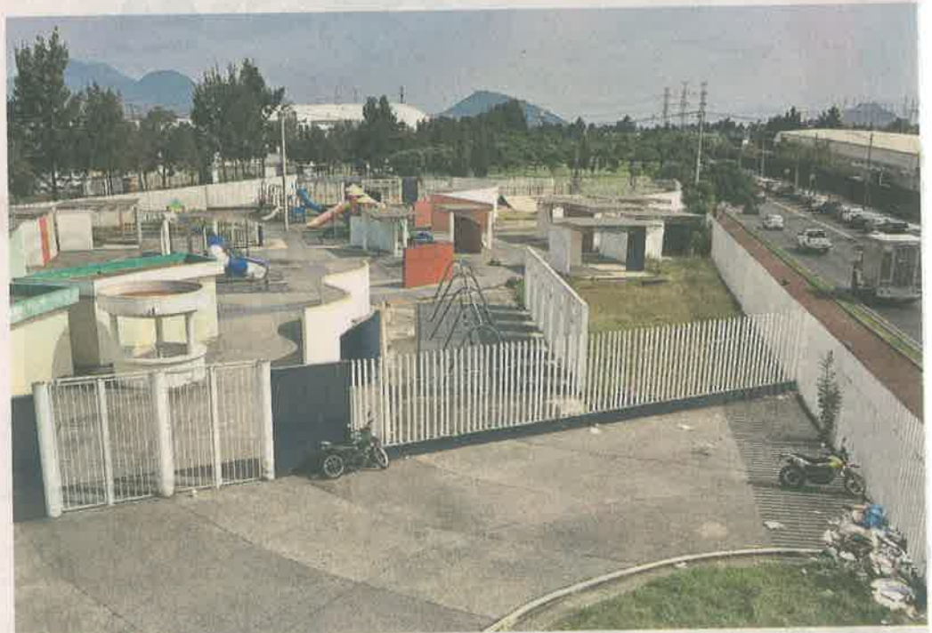
Comerciantes y colonos señalaron que desde hace 10 años se le impide el acceso a los niños.

“Nunca lo abren, a los niños no los dejan meter, según es nada más para los hijos de ellos (policías federales). Así