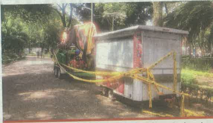
Los juegos fueron acordonados por Protección Civil sin mostrar papeles, denuncian.