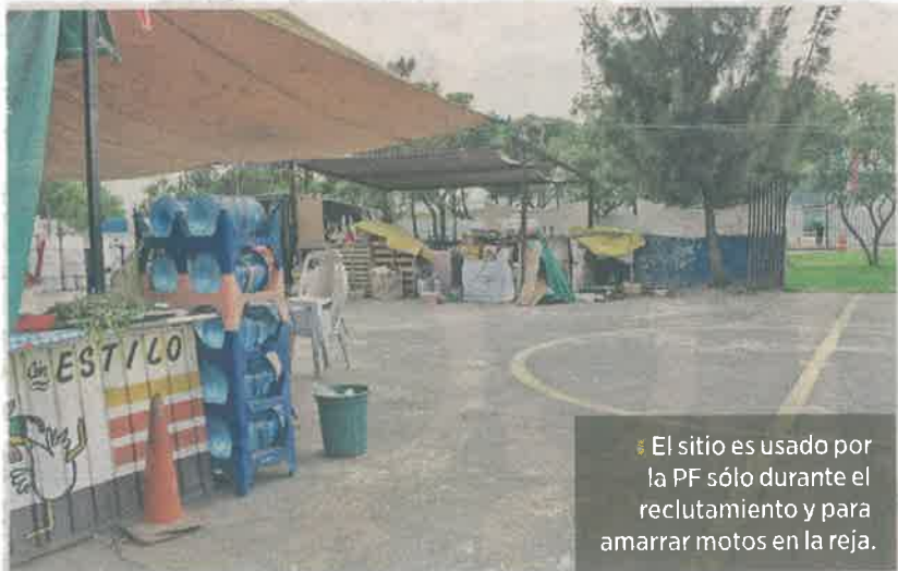
El sitio es usado por la PF sólo durante el reclutamiento y para amarrar motos en la reja.

En el camellón de Periférico Oriente, entre Eje 6 Sur y Eje 5 Sur, frente al acceso B del Centro de Mando de la Policía Federal, hay un parque infantil que, desde que se construyó hace 10 años se le niega el acceso a los niños, acusaron vecinos.