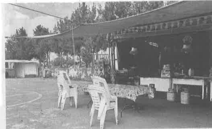
■ Alrededor del camellón de Periférico Oriente hay diversos puestos de comercio en vía pública.