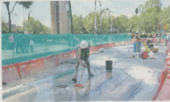
Un empleado señaló que las obras empezaron hace un mes.

Sin embargo, al no haber ningún semáforo, los vehículos pasan por la avenida