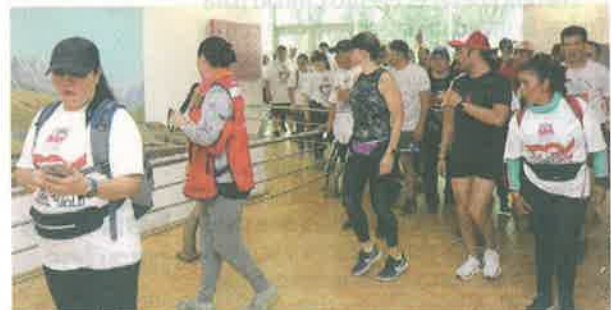
CORREDORES visitan centros culturales en la alcaldía, ayer.

En su primera edición los participantes conocieron, además del Parque Lincoln, el Centro Cultural Nelson Mandela, el Teatro Ángela Peralta, el Obelisco a Simón Bolívar, el Auditorio Nacional, las fuentes de las Ranas, de Nezahualcóyotl, y de la Templanza; los Baños de Moctezuma, el Museo del Caracol, el Museo de Arte Moderno, el Altar a la Patria y la Puerta de los Leones.