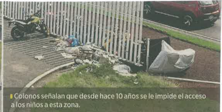
Colonos señalan que desde hace 10 años se le impide el acceso a los niños a esta zona.