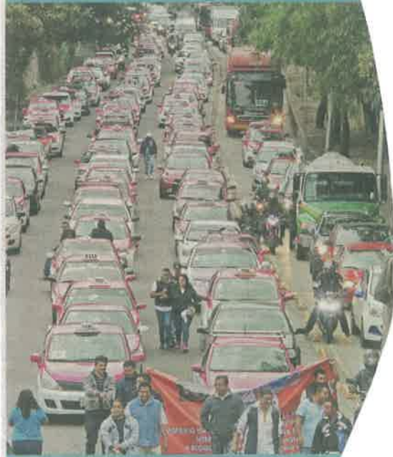
Los taxistas planean repetir hoy la dosis de caos que generaron el 3 de julio pasado.

Los ruleteros afirman que no se han cumplido los acuerdos a los que llegaron en el diálogo con la Secretaría de Movilidad.