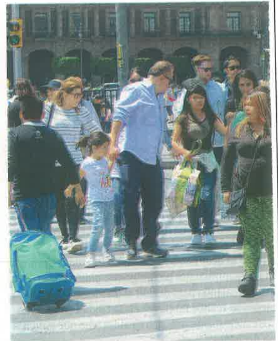
La incidencia delictiva no ha sido causa para que dejen de visitar la ciudad

TURISMO RUN Corriendo y Turisteando incluye el Parque Lincoln, el Centro Cultural Nelson Mandela, el Auditorio Nacional, entre otros