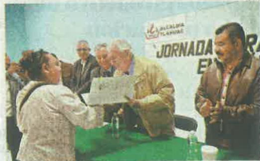
En Tláhuac, seis ejidos en conflicto

Reconoció que las alcaldías que enfrentan conflictos agrarios, son: Tláhuac, seis ejidos; Xochimilco y Milpa Alta uno cada una. En los ocho existen predios en donde el propietario no recibe atención legal adecuada, ya que su terreno está ubicado en ambas entidades.