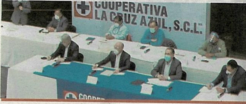
Siguen los problemas en el equipo cementero.