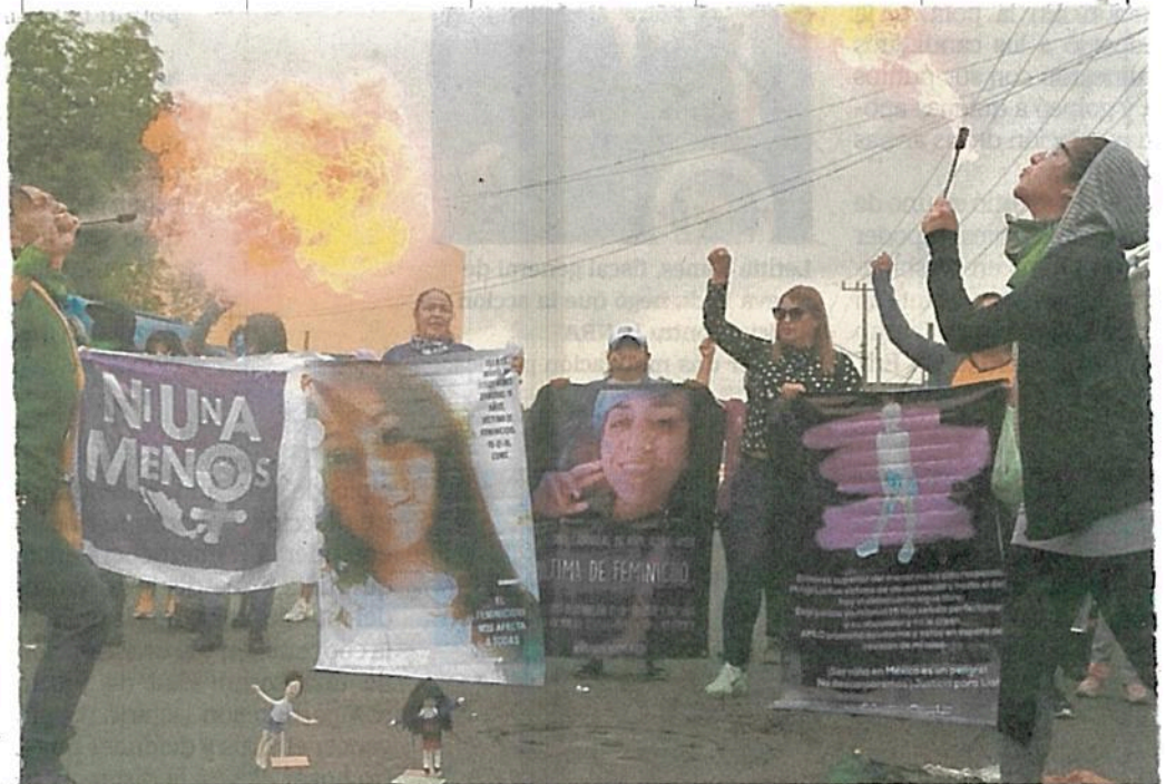
Mujeres de diversos colectivos quemaron mantas y vandalizaron las casetas del Reclusorio Oriente la tarde de ayer, cuando se llevó a cabo una audiencia para analizar el caso de la violación de una niña por parte de su tío.

"Queremos quemar, destrozar, para que nos vean, nos escuchen y se le dé voz a esta niña, a todas las violentadas que no han recibido justicia"