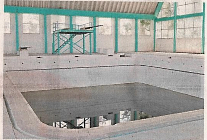
La fosa de clavados presenta una fisura en la base, por lo que se fuga el líquido y no está en servicio.

“No hay ninguna contraprestación en favor de la Mixhuca, de la Ciudad, no podemos retirar el Estadio de Beisbol (Alfredo Harp de