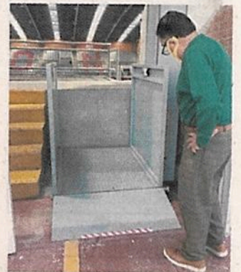
Los elevadores de la Sala de Armas no funcionan.

Asimismo, el lago artificial será desmantelado, pues su mantenimiento requiere de 200 mil pesos mensuales.