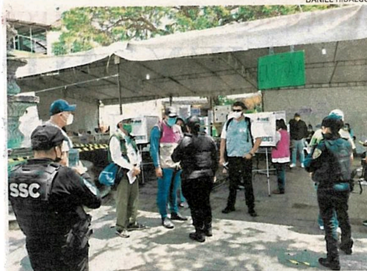
Policías estuvieron atentos a las solicitudes de las casillas