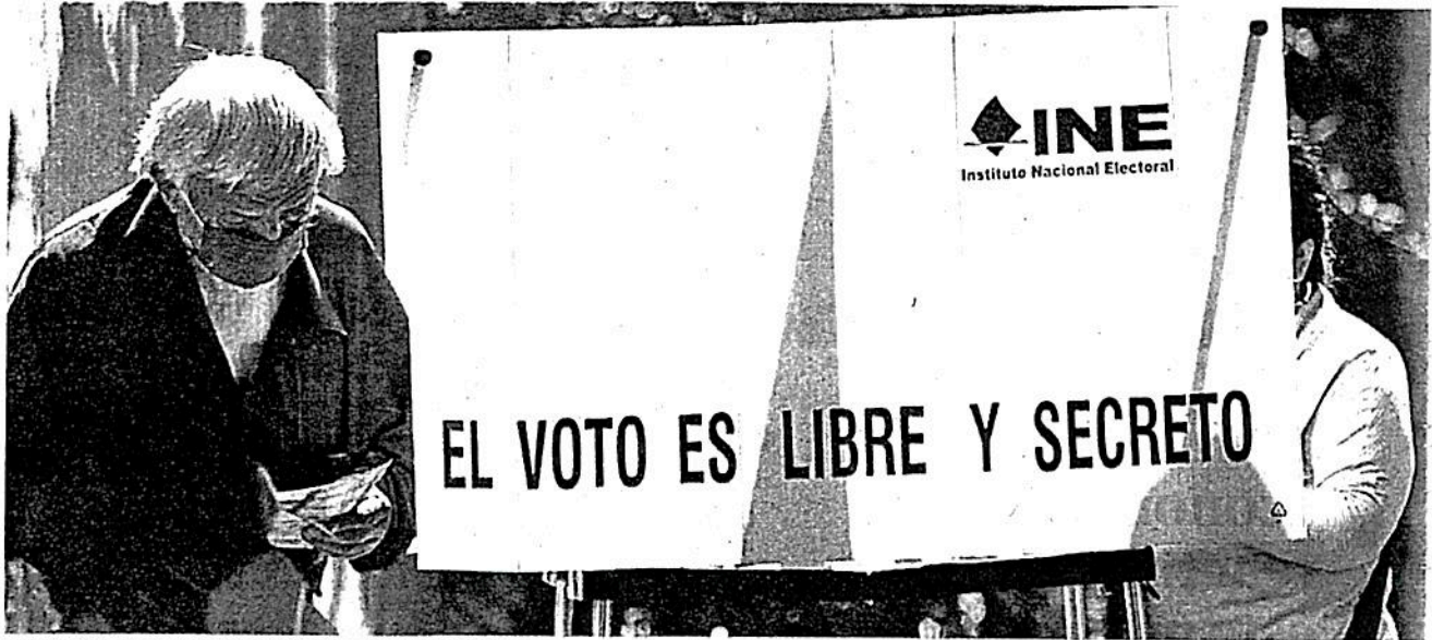
Las votaciones se llevaron a cabo con incidentes menores en las 16 alcaldías.