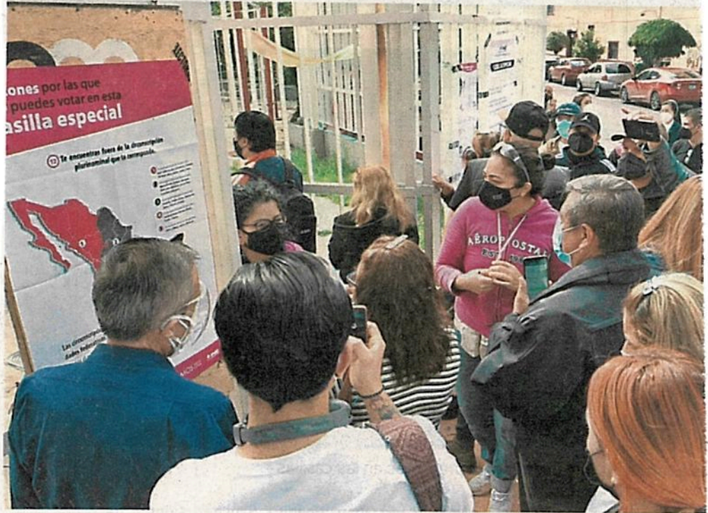
Personas procedentes de otros estados acudieron a las casillas especiales a votar

Estaremos analizando todas las carpetas que se abrieron”