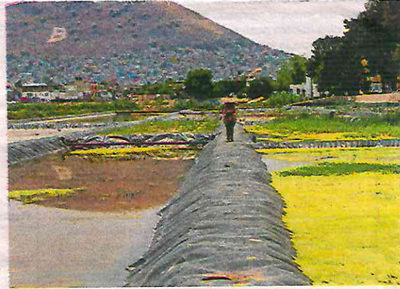
Esta es la zona donde se trata el agua

“Más allá de venir y meternos con una lancha, la recreación de un sistema natural también está en venir, observar la naturaleza y apreciarla, y no directamente meternos a jugar, tampoco nadar, porque es muy peligroso. Hay que respetar la vida de muchas aves vienen desde Estados Unidos y Canadá”, dijo.