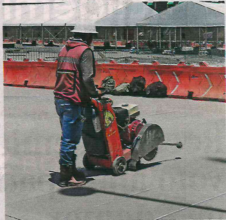
El reflejo del bajo crecimiento en productividad impacta en la creación de empleos formales, dice Coparmex