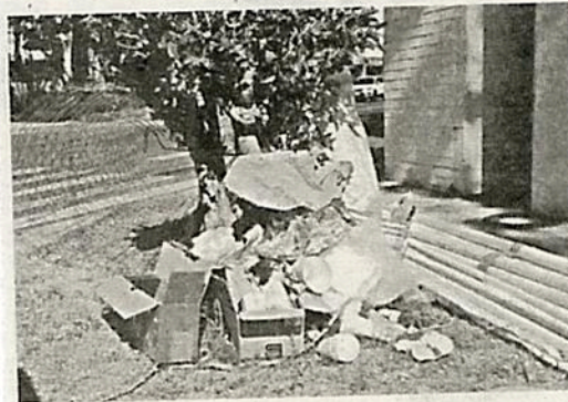
Hacen chiqueros con dinero público

Otra de las quejas de los residentes, fue que "hicieron un hoyo en la caseta de la colonia sin autorización", y a modo de advertencia, expresaron que si la demarcación la pone como ganadora de algún proyecto no la acepten. "La caseta es propiedad de los colonos, no de la @TlalpanAl. Es como si se metieran a tu casa a hacer un hoyo sin permiso", expresaron.