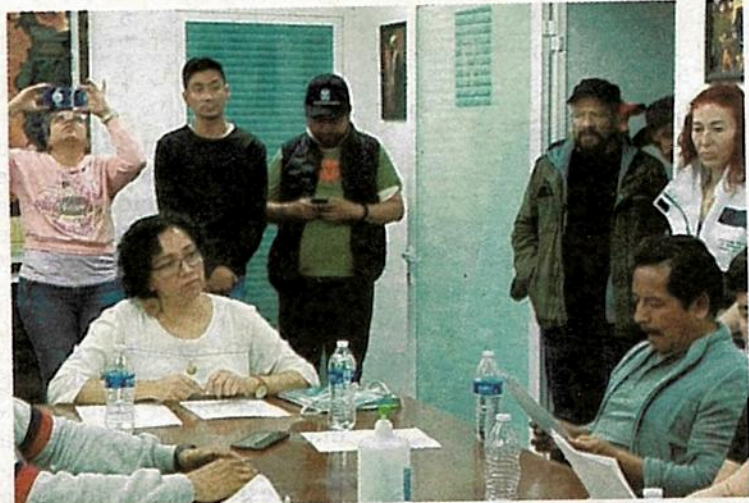
Acusan al personal de la alcaldía de no establecer una mesa de diálogo en la que se puedan establecer estrategias para proteger a las minorías

Además, acusan al personal de la alcaldía de no establecer