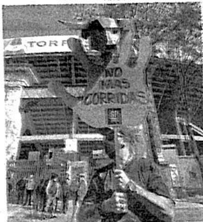
No incluyen las corridas de toros