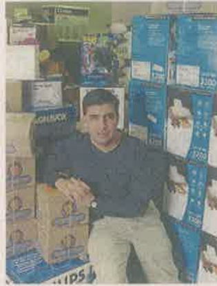
■ El empresario faltó a firmar y a una audiencia.

“Si no se presenta y no justifica, vamos a pedir que le cambien las medidas cautelares”, señaló la Procuradora