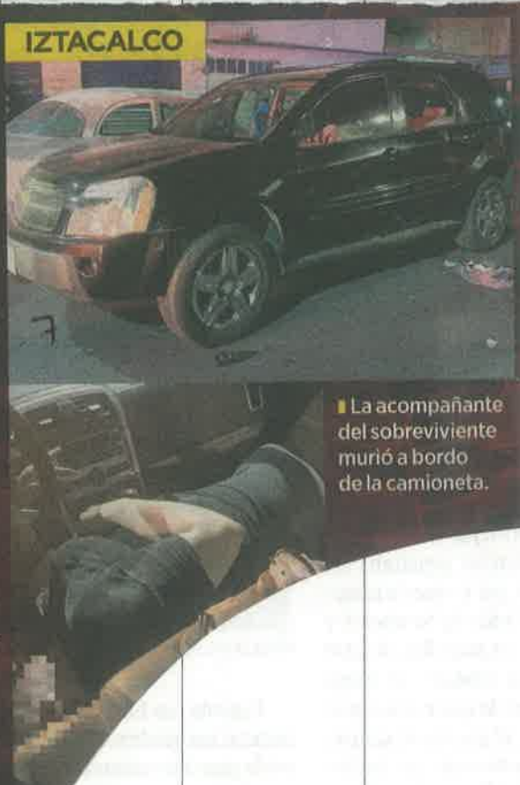
La acompañante del sobreviviente murió a bordo de la camioneta.

Mientras que el hombre, de unos 50 años, recibió impactos en la cabeza y el tórax, por lo que fue llevado al hospital.