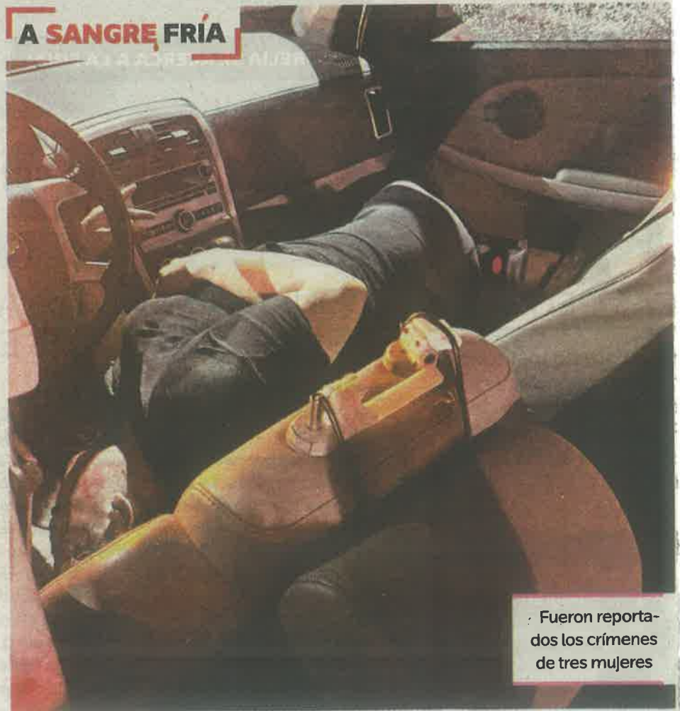
A SANGRE FRÍA

La dama quedó muerta al interior de su unidad con varios disparos en la cabeza y su acompa-