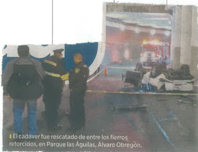
El cadáver fue rescatado de entre los fierros retorcidos, en Parque las Águilas, Alvaro Obregón.

A su vez, con apoyo de una grúa de la Secretaría de Seguridad Ciudadana (SSC), el vehículo siniestrado fue llevado al Ministerio Público y ahora forma parte de las evidencias.