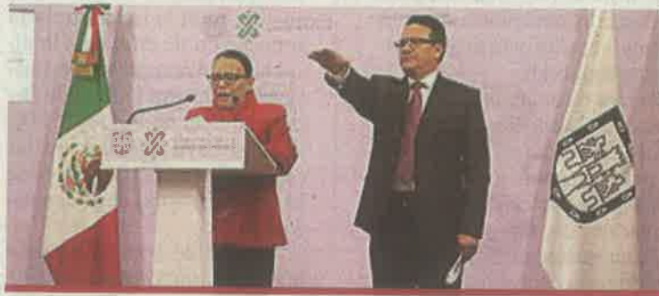
La secretaria de Gobierno, Rosa Icela Rodríguez, le tomó protesta.