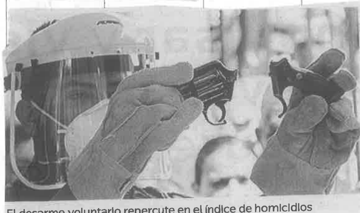
El desarme voluntario repercute en el índice de homicidios

se redujo el delito de homicidio doloso en la capital, de diciembre (2018) a octubre (2019).