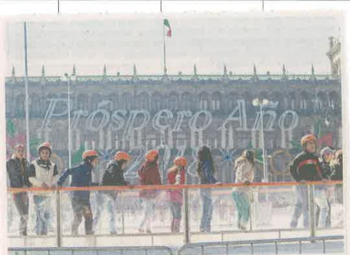
En años anteriores se colocaba una pista de hielo en la plancha del Zócalo, a la que asistían miles de visitantes.

La pista es una de las atracciones navideñas que ofrece la Ciudad, mismas que cerrarán con un concierto de fin de año con Los Ángeles Azules.