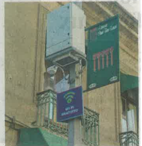
El gobierno capitalino cumplió la meta de brindar conexión a Internet gratis en 13 mil 694 postes

to que desde que se realizaron el contrato con Telmex se ahorraron bastantes millones en la conectividad de estos postes inclusive fueron conectados a través de fibra óptica.