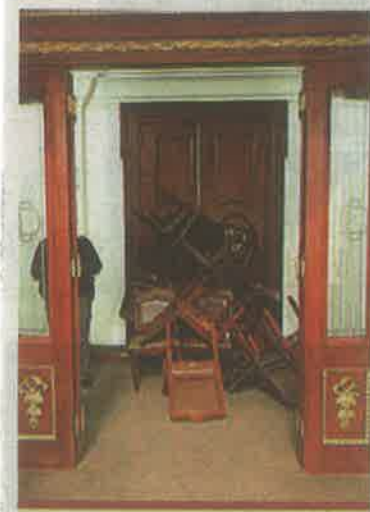
Con sillas impidieron el ingreso de manifestantes.