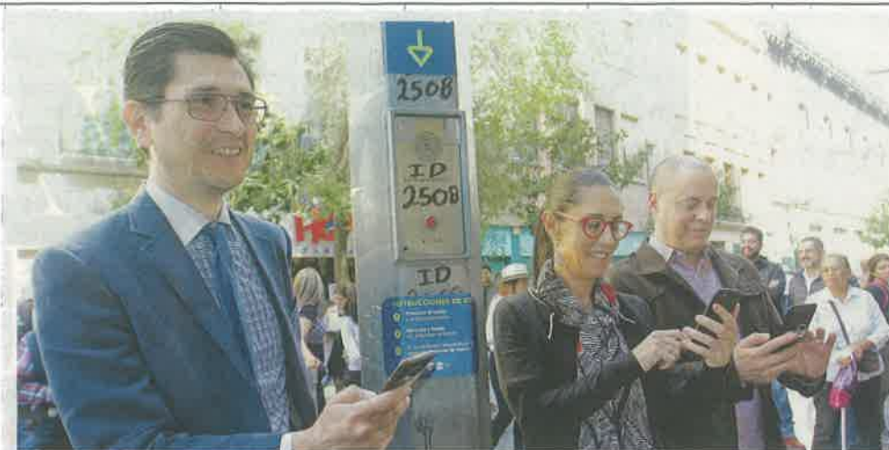
EL ÚLTIMO DEL AÑO. La jefa de Gobierno, Claudia Sheinbaum, inauguró el último punto de acceso en la calle Motolinía, esquina con 16 de Septiembre, en el Centro Histórico.

La conexión se ofrece “a través de un contrato que se tiene con Teléfonos de México, un contrato que como lo mencionamos al principio del Gobierno, representa inclusive una menor erogación de la que había el año pasado”, dijo Sheinbaum.