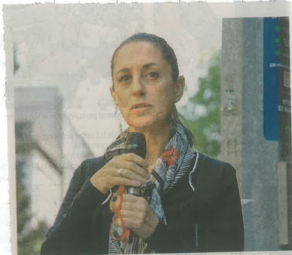
Mañana sábado, el informe de labores de la jefa de gobierno, Claudia Sheinbaum Pardo

Al preguntarle si los resultados en materia de seguridad en este año son suficientes, la funcionaria respondió: "no lo vería como suficientes o no me parece que se trata de un tema que la ciudadanía está demandando, es una exigencia, se han reducido algunos delitos, hay otros que no, y existe una cifra negra muy grande en cuanto al robo a transporte público