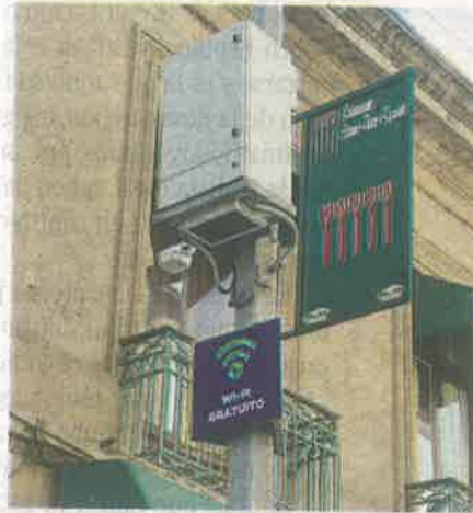
Ya está operando el punto de internet gratuito número 13 mil 694

El titular de la ADIP, José Merino, resaltó que cumplió la meta para 2019 que era de instalar los 13 mil 694 postes.