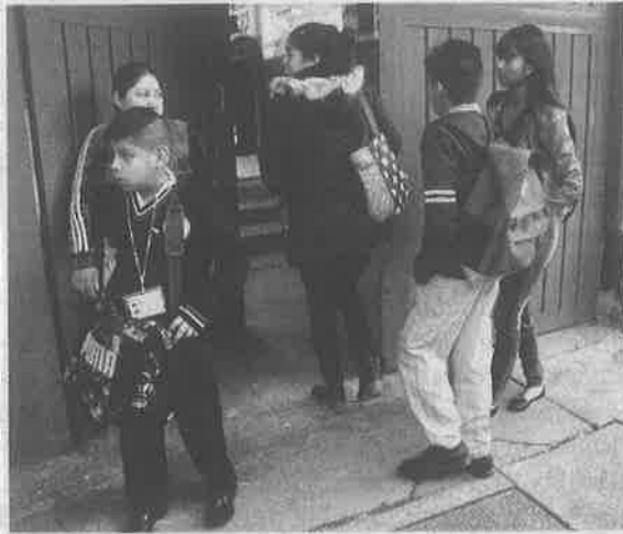
CDMX, número dos del mundo con conectividad