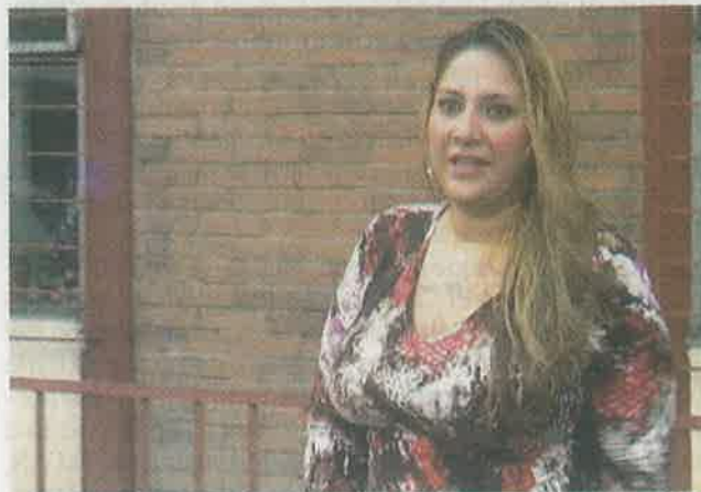
LA PGJ YA CERRÓ EL CASO