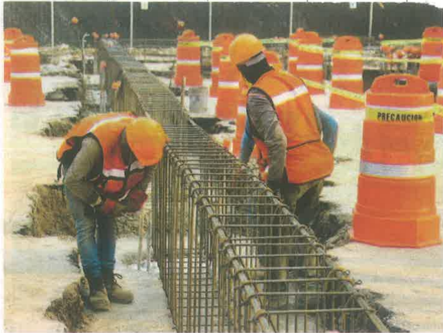
Apenas hace unas semanas inició la construcción en Indios Verdes