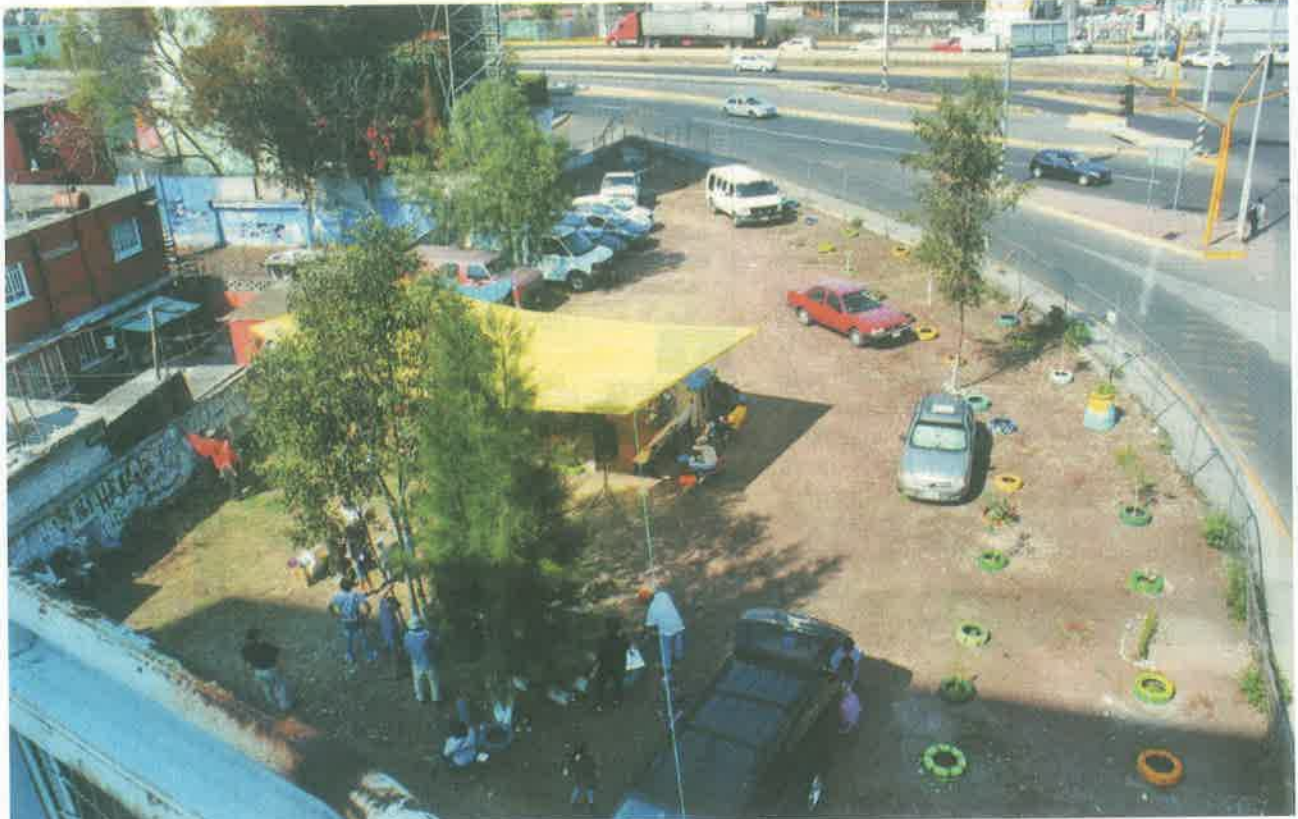
POR EL PUEBLO | El comité de vecinos rescató el baldío en el que fue el bloqueo y ahora es el Parque 11 de Noviembre.