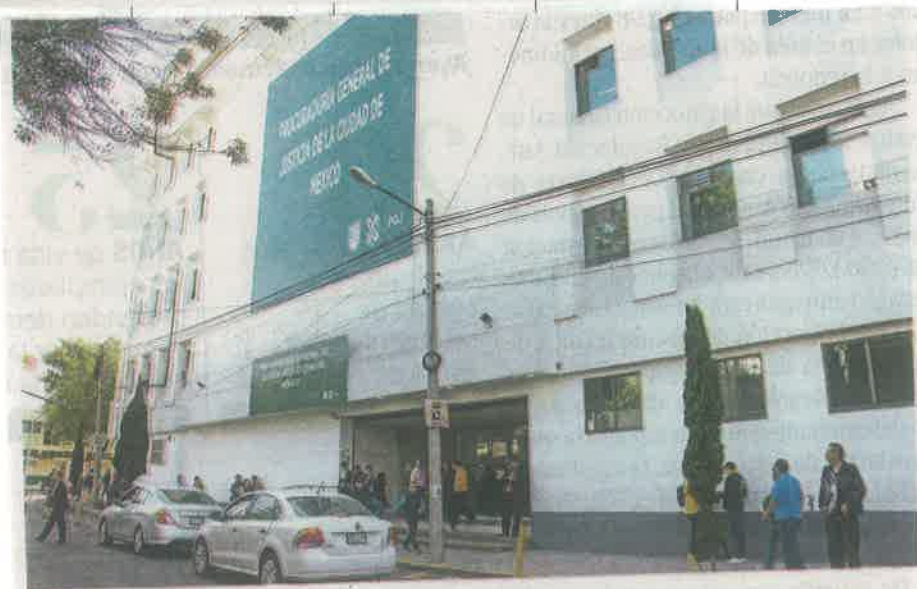
La procuradora aseguró que este caso se trató como otros

“Es muy importante que las redes sociales se sigan utilizando y que el Gobierno haga una revisión de estas redes”.