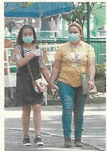
La alcaldía Benito Juárez regaló tapabocas a los habitantes,

Cabe mencionar que 14 alcaldías, excepto Benito Juárez y Venustiano Carranza, desembolsaron millones de pesos para echar a andar la acción social de Mercomuna, que fue impulsada por la jefa de Gobierno.