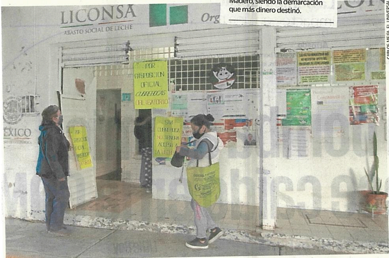
CARLOS MEJIA - EL UNIVERSAL

erogó la alcaldía Gustavo A. Madero, siendo la demarcación que más dinero destinó.