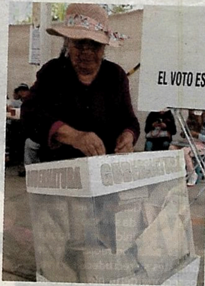
La pregunta fundamental rumbo a 2024 es quién representa lo que los votantes demandan en las urnas.

En esa justa electoral venció a partidos con décadas de historia, los vencidos y sus porcentajes fueron, el Verde (6.9 por ciento), Movimiento Ciudadano (6.1), Nueva Alianza (3.7), Encuentro Social (3.3), PT (2.8), Humanista (2.1 por ciento), de acuerdo con datos del INE. Tres años después, en las elecciones de 2018, Morena se alzó victorioso respaldado con 53.2 por ciento de los votos, su oponente más cercano fue Ricardo Anaya con 22.3