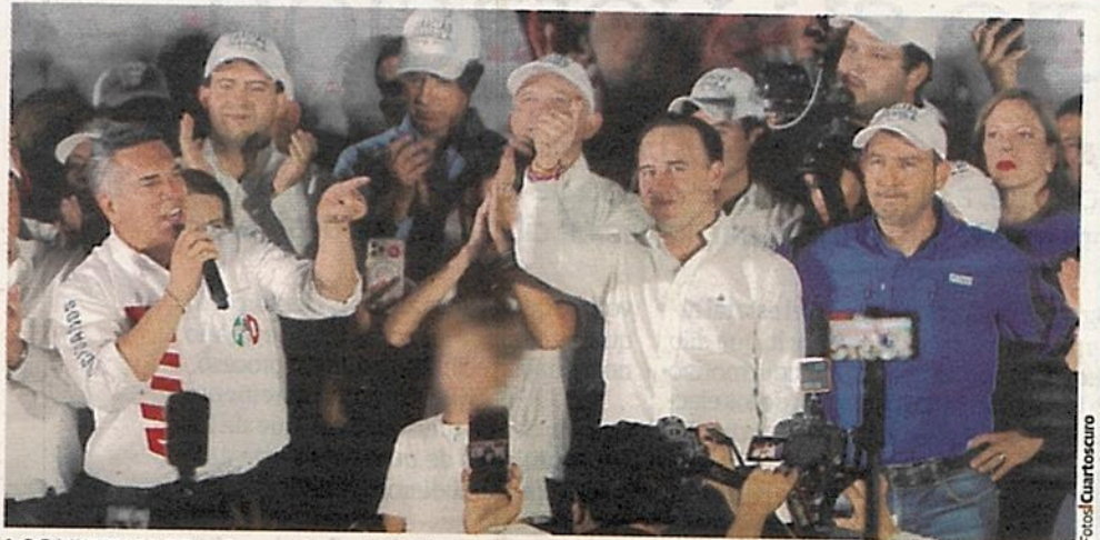
LOS VIRTUALES gobernadores del Edomex (arriba) y Coahuila, el domingo, en conferencia de prensa tras conocer los resultados del conteo rápido.