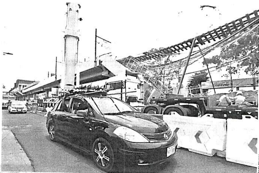
Un auto con una corona fúnebre pasó ayer por el punto del colapso, sobre Av. Tláhuac, mientras la FGJ realizaba las diligencias.

“Nuestra aseguradora está lista para responder por el conducto de nuestro clien-