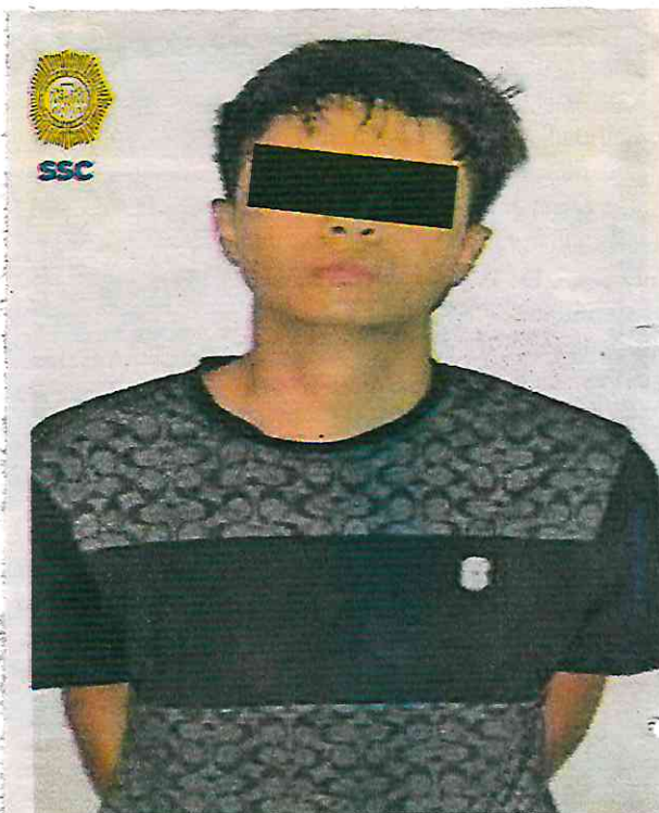
El imputado cuenta con un ingreso al Sistema Penitenciario de la Ciudad de México

Cabe hacer mención que, después de realizar un cruce de información, se tuvo conocimiento que el detenido cuenta con un ingreso al Sistema Penitenciario de la Ciudad de México por el delito de Extorsión en el año 2020, así como una presentación ante el Ministerio Público por robo a negocio en el mismo año.