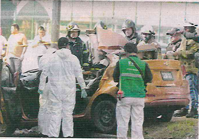
El copiloto del auto murió tras el choque contra un vehículo estacionado en la lateral de Eje Central Cien Metros.