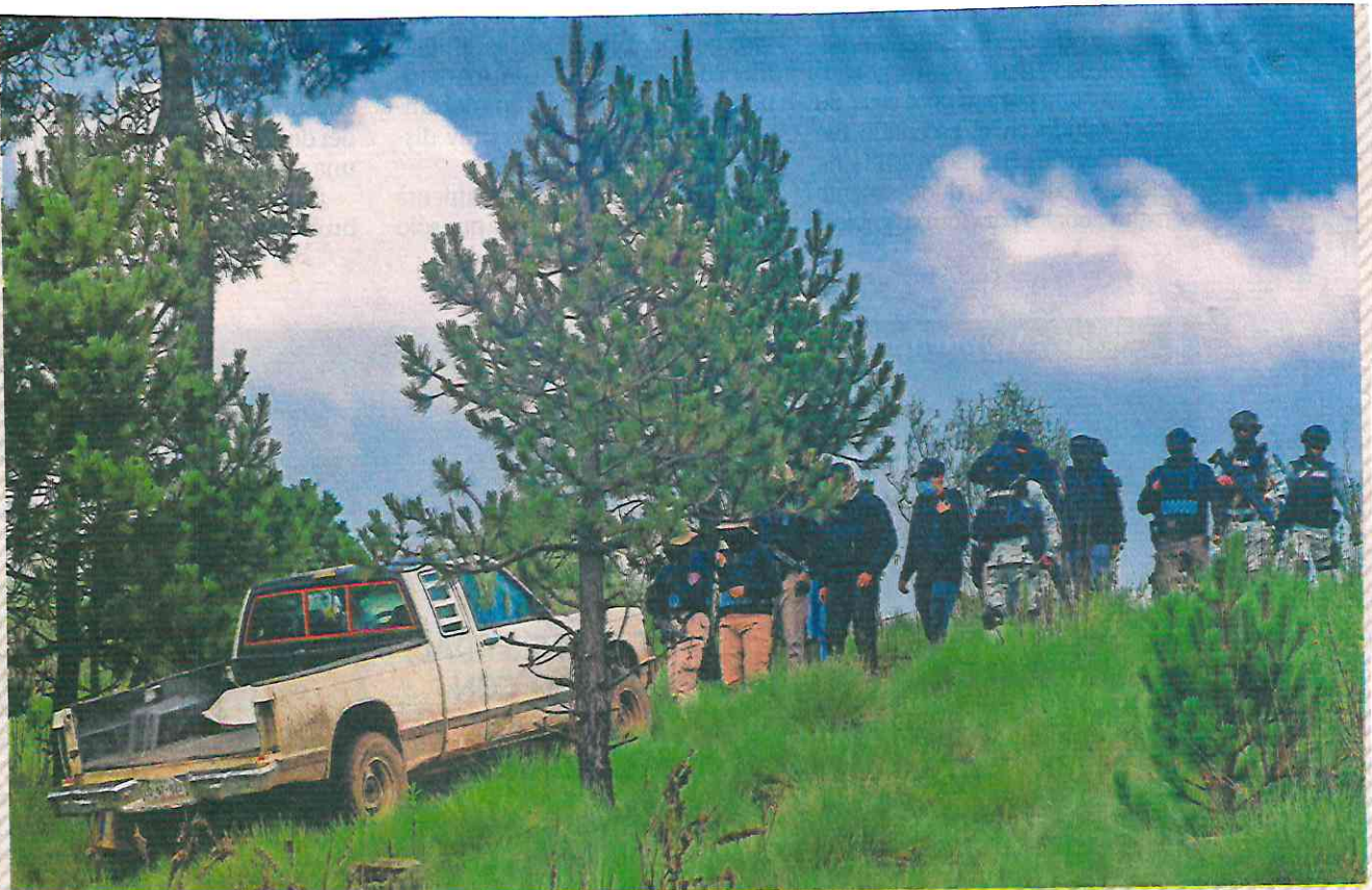
Agentes de la SSC han logrado realizar investigaciones y obtener información relevante en los parajes de Tlalpan y Milpa Alta.