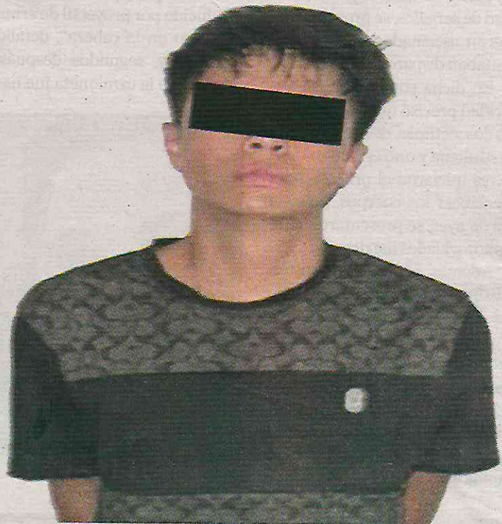
Fue capturado cuando se daba a la fuga

Por lo anterior, el hombre de 19 años de edad fue presentado ante el agente del Ministerio Público correspondiente, quien determinará en las próximas horas su situación jurídica.