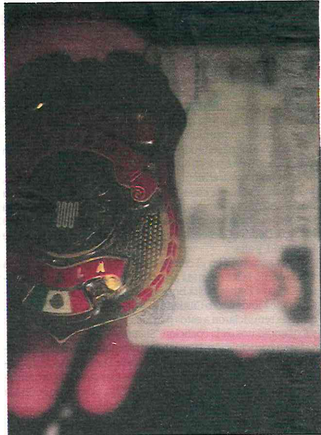
INDICIOS que registró la autoridad que lleva el caso de los menores de edad agredidos por un sujeto.