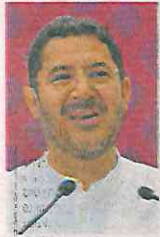
Martí Batres Guadarrama

:::: Falta menos de un mes para la elección de jefe de Gobierno y la pugna entre el mandatario capitalino, Martí Batres , y los panistas está al rojo vivo. Si bien don Martí ha sido cuidadoso en a