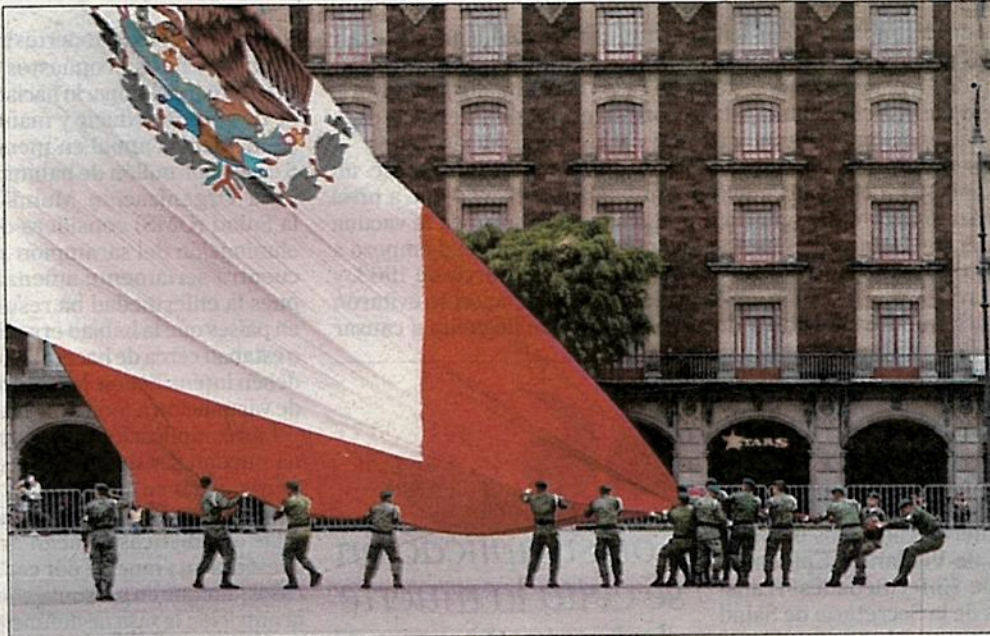
▲ Sin el acostumbrado público ciudadano que suele acompañar este acto vespertino en el Zócalo de la Ciudad de México, soldados arrían la bandera.