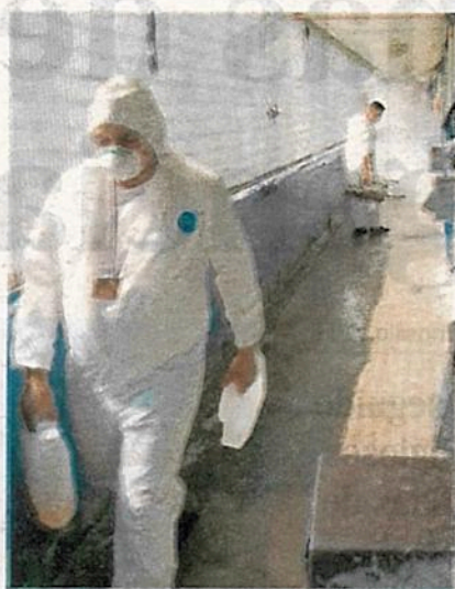
El fin de semana inició la sanitización de los reclusorios

Por ello, pueden dejar libre a las personas que tienen una sentencia menor a cinco años, por motivos humanitarios