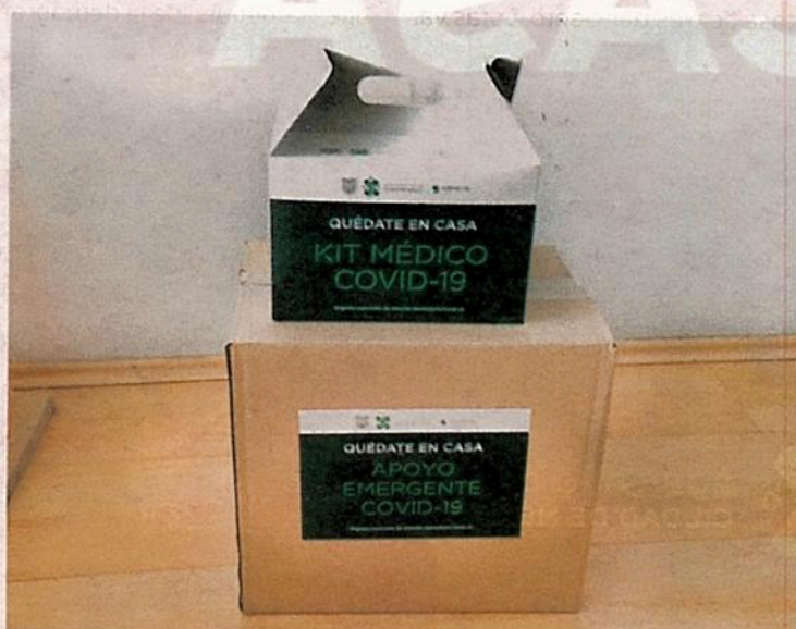
Les brindan dosis paracetamol para hasta 17 días, cubrebocas y una despensa básica

El pasado sábado 28 de marzo decidió hacerle frente al malestar. Como seguía por las mañanas los anuncios de la jefa de Gobierno, Claudia Sheinbaum y cada noche las conferencias del Subsecretario de Prevención y Promoción de la Salud, Hugo López-Gatell, supo qué tenía que hacer