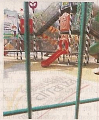
Los espacios están cerrados con rejas.

“Está bien porque todo el mundo se agarra de los tubos y hay mucho contacto en el deporte. Cualquiera se puede contagiar, tomarse de