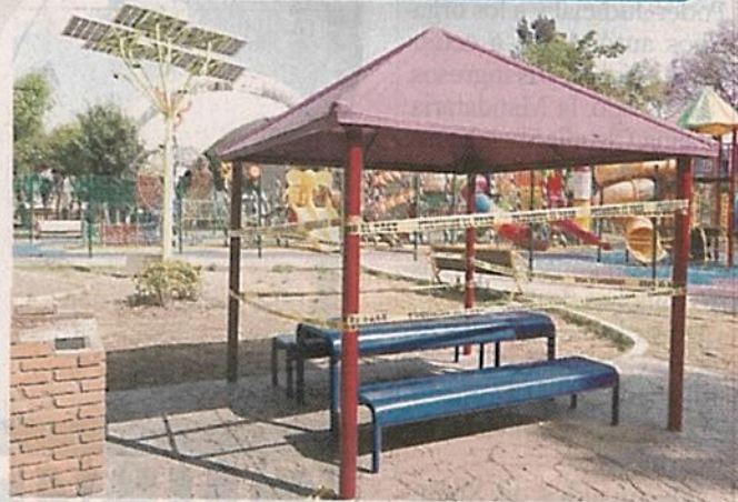
La Alcaldía señaló a los visitantes que la medida es temporal.

Para la Alcaldía Venustiano Carranza, esta medida representa dejar de recibir