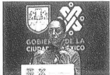
La Jefa de Gobierno, Claudia Sheinbaum, no descartó que para la ampliación de la Línea 3 del Metrobús se realice una consulta ciudadana.

En conferencia de prensa, Sheinbaum Pardo detalló que en su administración "lo importante" es el diálogo y añadió: "A lo mejor no hay unanimidad y hay una minoría que no está de acuerdo, pero la gran mayoría lo está. Por eso, digamos, se pospuso par-