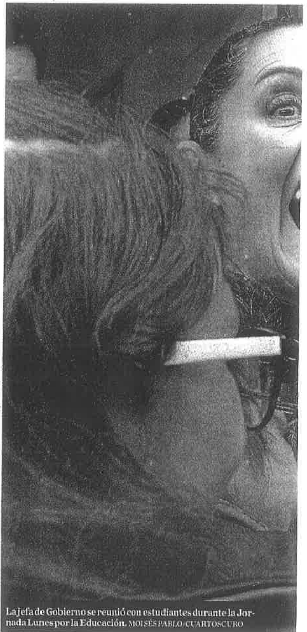
La jefa de Gobierno se reunió con estudiantes durante la Jornada Lunes por la Educación.

"Es importante decir que cualquier constructora que no tenga problemas administrativos con la ciudad podrá incorporarse a este programa, además, en esta quincena daremos a conocer las facilidades que podrán tener todos los que tienen crédito con el Invi para pagar en diferentes lugares lo cual será mucho más transparente el proceso".