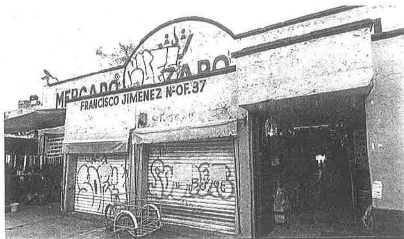
Actualmente el mercado luce vacío, sin clientes y los locatarios piden resultados a las autoridades.

❖ Crónica documentó en días pasados la existencia de tres mercados sin reconstruir y un centro cultural sin uso