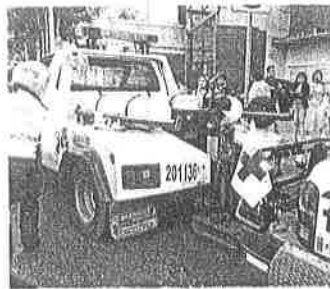
El parque de grúas de la SSC es de 46 unidades, sin embargo solamente se encuentran operativas 36 de ellas.