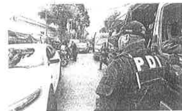
Elementos de la Policía de Investigación dicen apoyar la depuración de agentes corruptos, pero aún esperan mejoras en las condiciones de trabajo.

DE LOS AGENTES DE LA POLICÍA DE INVESTIGACIÓN DICEN APOYAR LA DEPURACIÓN DE AGENTES CORRUPTOS, PERO AÚN ESPERAN MEJoras EN LAS CONDICIONES DE TRABAJO.