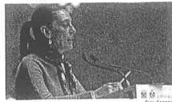
La jefa de Gobierno, Claudia Sheinbaum, ayer en conferencia

«Cambiamos el modelo de desarrollo de la ciudad, pasamos de los últimos años de un modelo de exclusión a un modelo incluyente: pasamos de la opacidad a la transparencia, del abuso a ofrecer un derecho, de la ciudad de los automóviles a la ciudad de las personas, de la ciudad de la gentrificación a la ciudad de la inclusión», dijo.