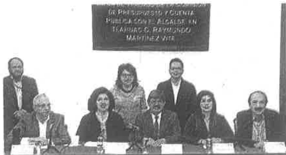
Las bancadas del PAN y PRD cuestionaron la situación en Zapotitlán.

Hacemos una propuesta, y ojalá nos puedan ayudar, con un presupuesto de 2 mil 257 millones 756 pesos, que creemos nos va a ayudar para atender las demandas que existen en la demarcación"