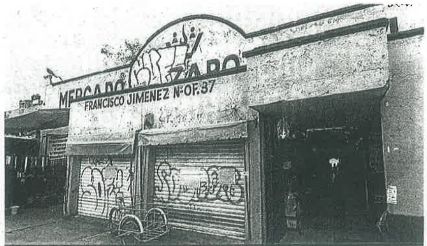
Actualmente el mercado luce vacío, sin clientes y los locatarios piden resultados a las autoridades.