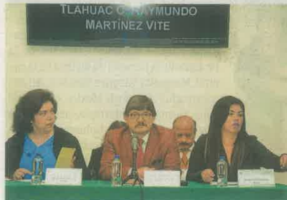
El alcalde de Tláhuac, Raymundo Martínez Vite, en la mesa de trabajo con la Comisión de Presupuesto y Cuenta Pública del Congreso capitalino

Informó que en 2019 se contó con un presupuesto modificado de mil 724 millones de pesos, y que para 2020 la Secretaría de Administración y Finanzas de la Ciudad de México envió un techo presupuestal de mil 754 millones de pesos, es decir, con un incremento de sólo 30 millones de pesos, que representan 1.74 por ciento, al cual calificó como insuficiente para atender las necesidades de la comunidad.