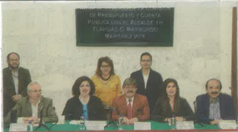
Las bancadas del PAN y PRD cuestionaron la situación en Zapotitlán.