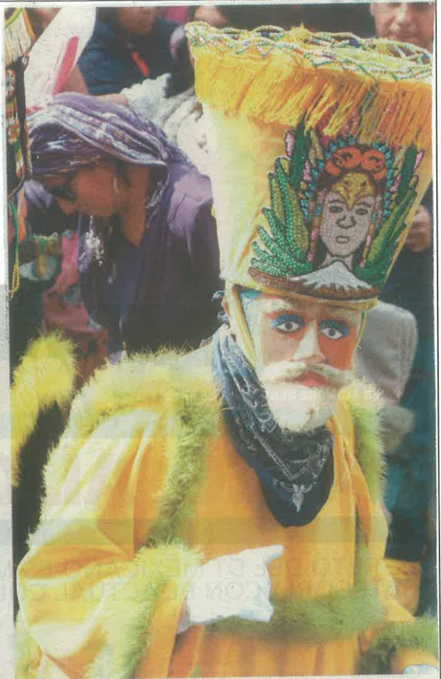
La recibieron y despidieron con danzantes y banda