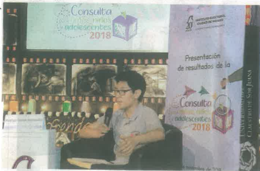
La inseguridad , uno de los problemas que más preocupa a los menores

Educativo Albanta, dio a conocer esos datos, de los cuales destacó que el 52% son menores de 6 a 9 años, el 35%, de 10 a 13 años, y el 13%, de 14 a 17 años, y que los tres principales problemas reportados en el ejercicio son: la inseguridad, con 28.15%; la falta de áreas recreativas y deportivas, con 25.07%, y el impacto ambiental y la higiene pública, con 16.63%.