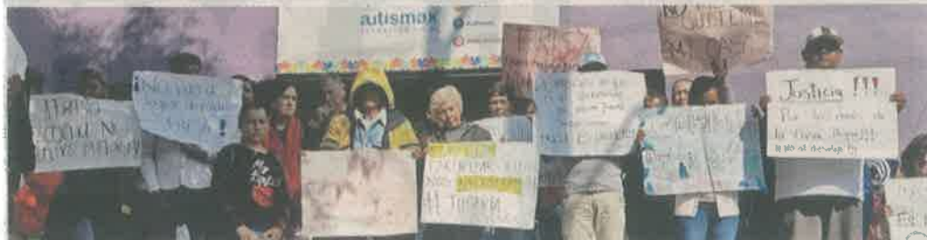
■ Esta es la quinta vez que intentan desalojar a las IAP de un predio en Fuentes de Satélite.

Argumentó que esos recursos no les alcanzan.