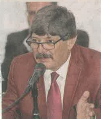
■ Raymundo Martínez Vite, Alcalde de Tláhuac.