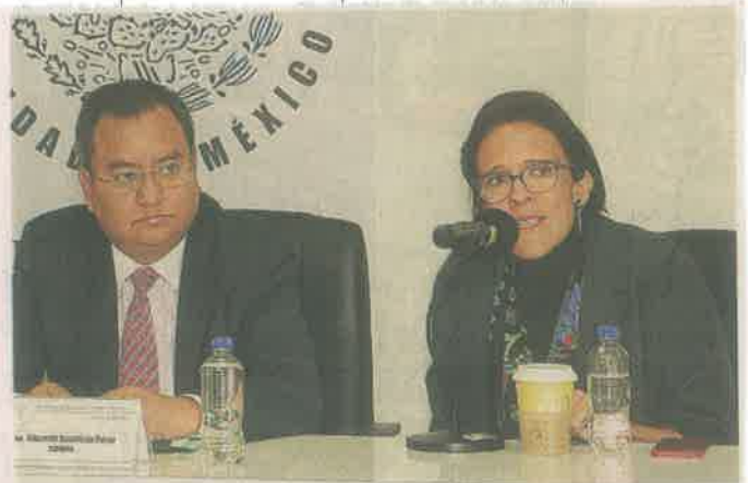
Los expertos de la Comisión de Transición llevaron al Congreso la iniciativa de Ley Orgánica de la Fiscalía.

También se propone que la persona titular de la Fis-