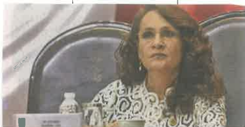
PERSONAJE. La diputada federal fue delegada en la Cuauhtémoc de 2000 a 2003.