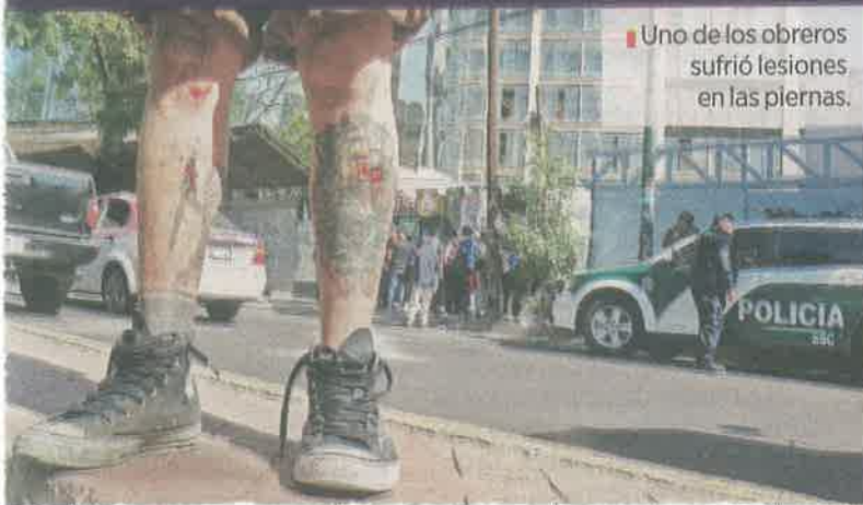
Uno de los obreros sufrió lesiones en las piernas.