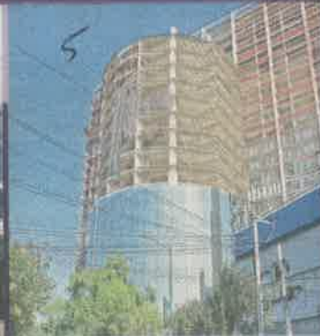
Policías del Sector Tacuba realizaron un rastreo... sin éxito.