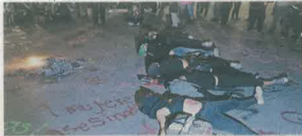
NOVIEMBRE 25. El día contra la violencia hacia las mujeres se desarrolló otra protesta.