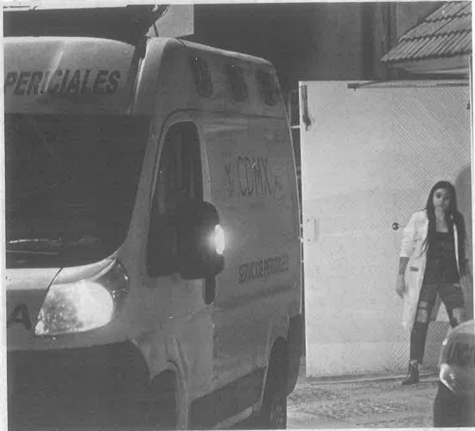
Dos motociclistas llegaron a su domicilio; le dispararon mientras se abría la puerta de su cochera

“Tenemos que cuidarnos entre nosotros. Las autoridades han sido incapaces. A cierta hora, la colonia está totalmente sola, muy tranquila, y más en la noche, pero eso no quiere decir que tengamos siempre asaltos, robos y hasta muertos. Hacemos un llamado a las autoridades”, apuntó el testimonio.