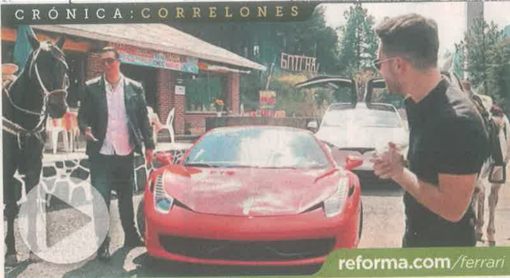
El video difundido en YouTube muestra la potencia del Ferrari 458 Spider y de un Tesla.