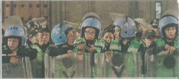
■ Durante las movilizaciones, las manifestantes lanzaron reproches contra las mujeres policías.