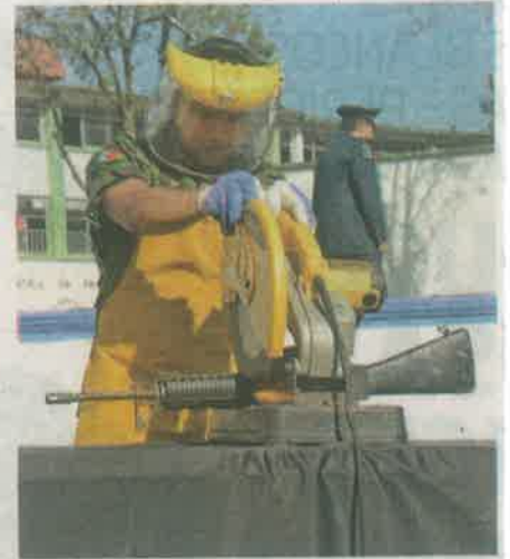
Están a la vista los resultados del programa Sí al Desarme, Sí a la Paz

diferentes armas de fuego entre revólveres, pistolas, subametralladoras, de alto calibre como R-15, granadas de fragmentación y un lanzagranadas.