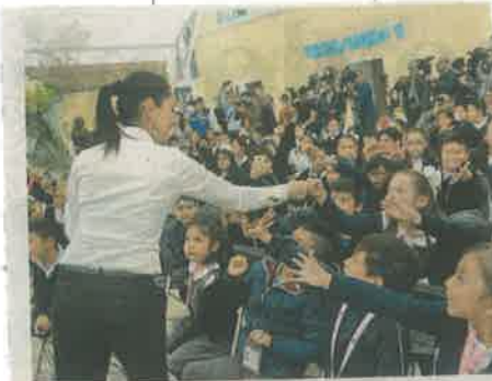
Claudia Sheinbaum visitó la primaria "Patrimonio Nacional", en la Colonia Del Valle Centro

Además ya se hacen estudios estructurales de todas las escuelas públicas y