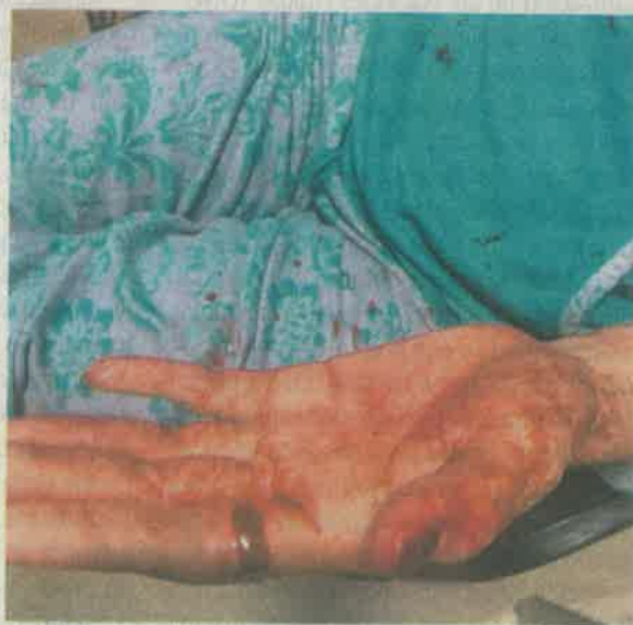
Abril fue asesinada el pasado 25 de noviembre

Ella fue llevada a un hospital, los mismo que sus hijos, pero horas después falleció por la bala recibida en la nuca.