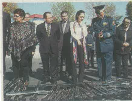
Se trata, dijo, que cada vez haya menos armas

Dijo estar convencida de que no es generando más violencia como se resuelven los problemas de inseguridad, “por el contrario, atendiendo de fondo las causas que han llevado a los problemas de inseguridad en nuestro país y en particular en nuestra Ciudad.