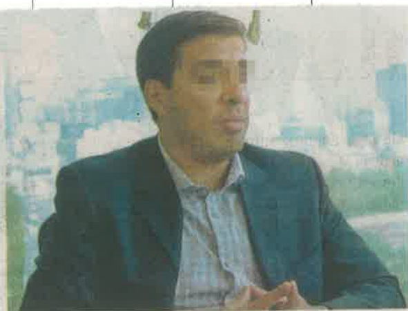
Este hombre fue el esposo de Abril; estuvo preso por intento de feminicidio

Primero: "imagínense sentir el dolor, la desesperación y la impotencia que yo como otras millones de mujeres sienten día a día por este tipo de inhumanidades. Imagínense