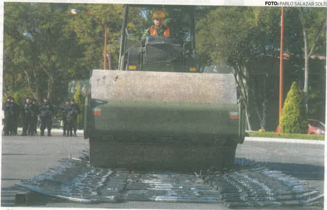
• PINOLE. Del total de armas reducidas ayer, 312 fueron largas y 216, cortas.

“Las armas que hoy se destruyen pudieron haber causado incidentes lamentables o la comisión de ilícitos que siempre generan daño directo a las familias”.