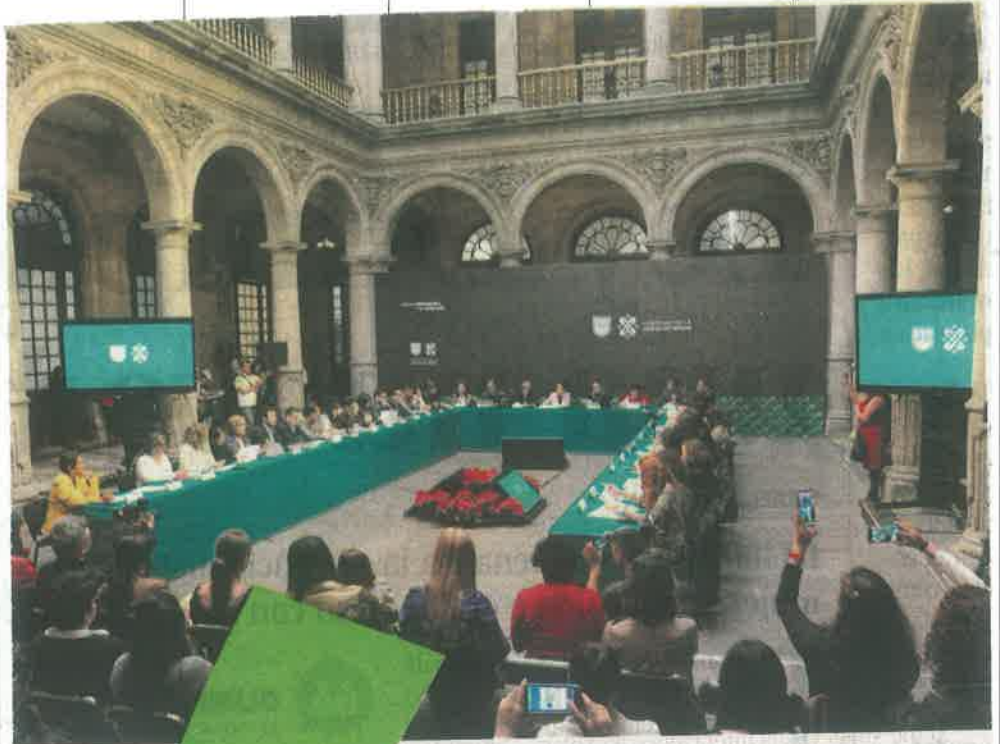
Están a cargo de las pantallas, sillas, templetes, grabación e iluminación/ERNESTO MUÑOZ