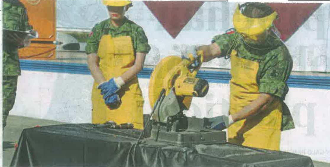
A diario se destruyen 10 armas en este programa capitalino