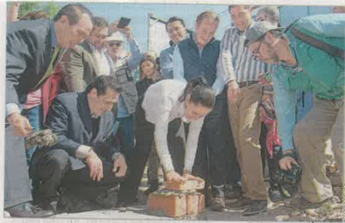
Avanza la reconstrucción en BJ CDMX P.9