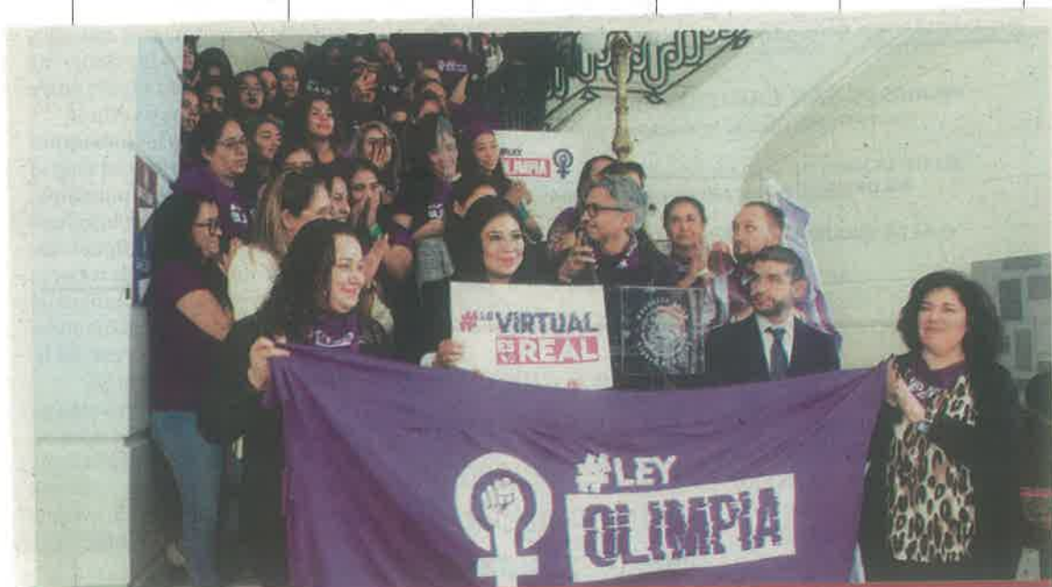
Integrantes de organizaciones feministas celebraron la aprobación de la ley que castiga difusión de imágenes íntimas.

"Sin que la chica o chico se dé cuenta se graba el momento en que tiene relaciones sexuales, y si ella o él no accede a hacer un favor o a cumplir un capricho de la persona que lo exige, comienzan las amenazas, y la mayoría de las veces el video o las fotos se comparten con un círculo cercano a la víctima, amigos, compañeros de trabajo y hasta familiares", explicó el experto.