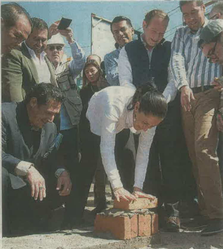
Este año se destinaron tres mil 500 millones para las obras