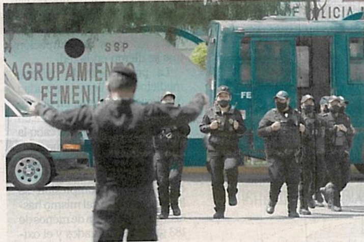
El agrupamiento femenil considera que las policías son más vistas y ahora tienen tareas exclusivas, ya no sólo acompañan a los hombres.

“La policía ha ido evolucionando en el tema de marchas, ahora no somos un grupo de choque, somos un grupo de contención y, en ese tenor, debemos reaccionar con firmeza sin caer en provocación”, destaca.