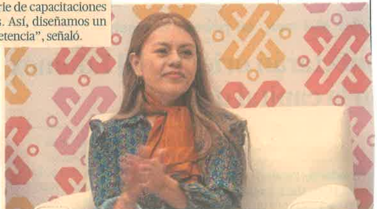
La secretaria destacó la importancia de la capacitación.