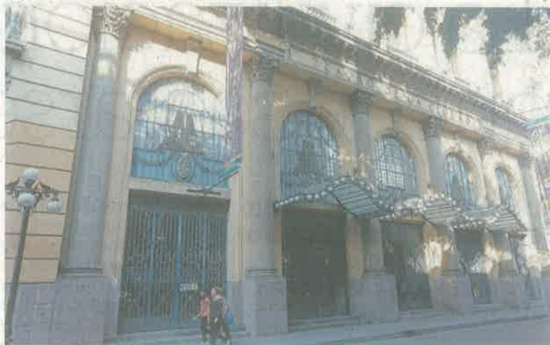
El Teatro de la Ciudad está entre los beneficiados por Sitios y Monumentos.