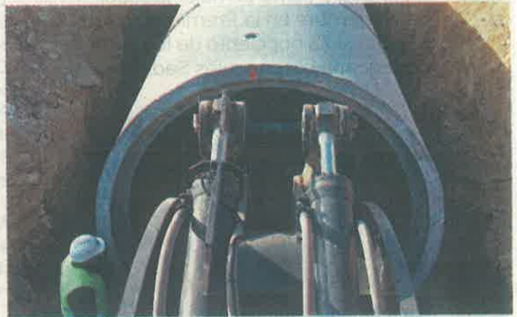
Millones se gastan para poder llevarla hasta los hogares

De acuerdo a la OCDE Méxicotlene una de las tarifas más bajas del mundo al pagar .49 dls por metro cúbico, a diferencia de Dinamarca donde pagan 6.40 dls