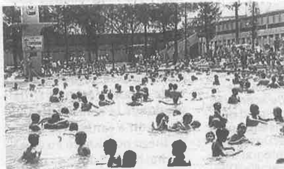
Uno de los balnearios de la Ciudad

ERAN LOS AÑOS DE LA POSTGUERRA, DE VISITAR LOS BALNEARIOS DE LA CALZADA ZARAGOZA Y LOS DE LA CALLE UNO