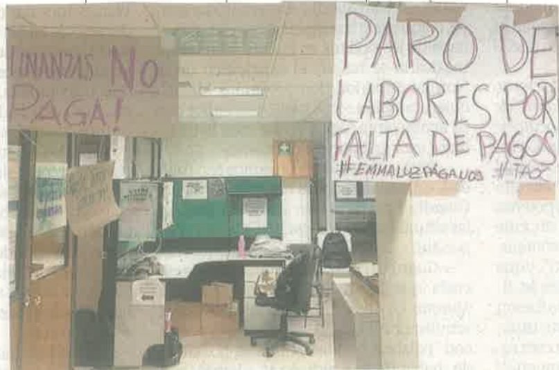
Pancartas de protesta que trabajadores han colocado en las oficinas de la Secretaría de Cultura local luego de que algunos llevan meses sin cobrar.

Entre las acciones de protesta, en redes están haciendo un llamado para que en solidaridad con quienes no han cobrado, no asistan a Radical Mestizo, el último festival organizado para este año, que se llevará a cabo el 7 y 8 de diciembre. ●