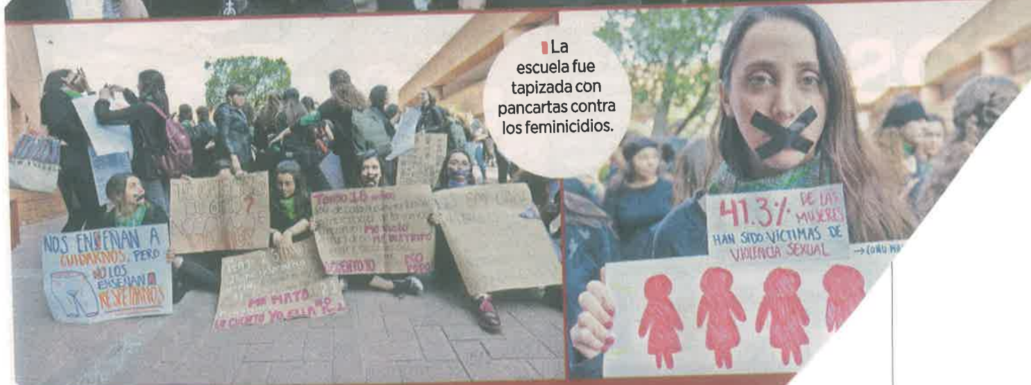
La escuela fue tapizada con pancartas contra los feminicidios.