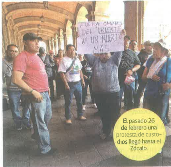
El pasado 26 de febrero una protesta de custodios llegó hasta el Zócalo.

Hay una recomendación directa contra la SSC por tortura psicológica y otra más contra la Consejería Jurídica, la SSC y la Secretaría de Movilidad.