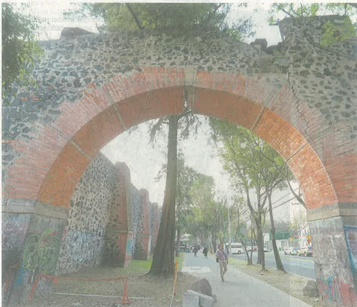
El Arco de la Antigua Hacienda de Coapa fue uno de los inmuebles afectados el 19 de septiembre de 2017. Aunque se aprobó un recurso, no han iniciado los trabajos de recuperación.