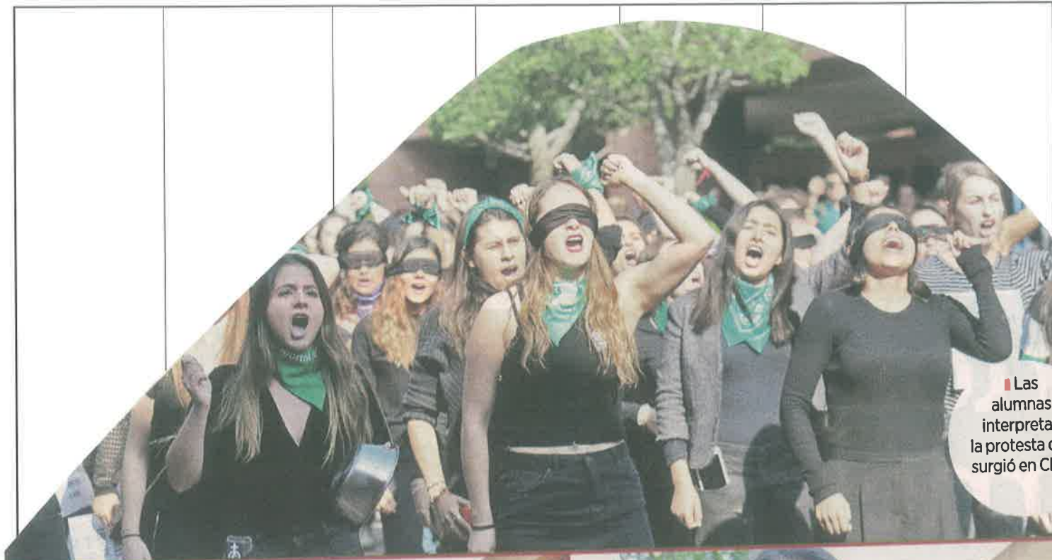
Las alumnas interpretan la protesta que surgió en Chile.