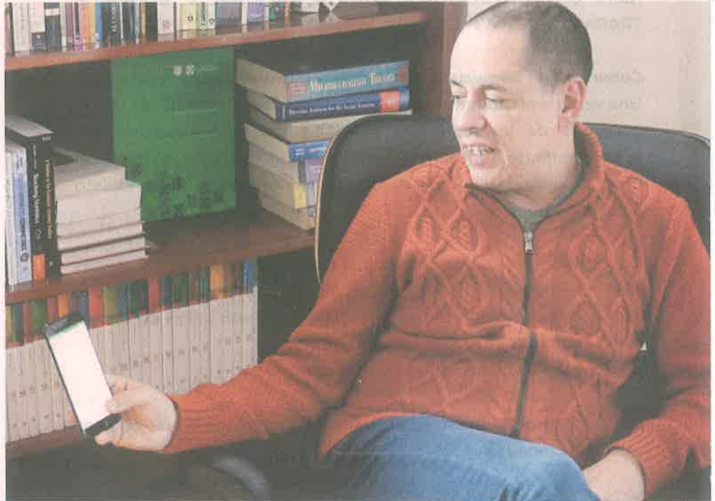
El responsable de innovar el servicio público busca elevar 20 veces la meta de ahorro en 2020.

“La ciudadanía verá cuánto tiempo le toma a cada autoridad cerrar reportes, vas