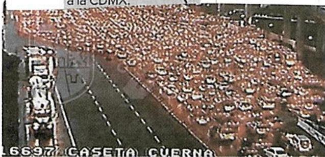
66977 CASETA CUERNA

se redujo el flujo de vehículos el 9 de abril, el día con menos autos en la calle durante la pandemia